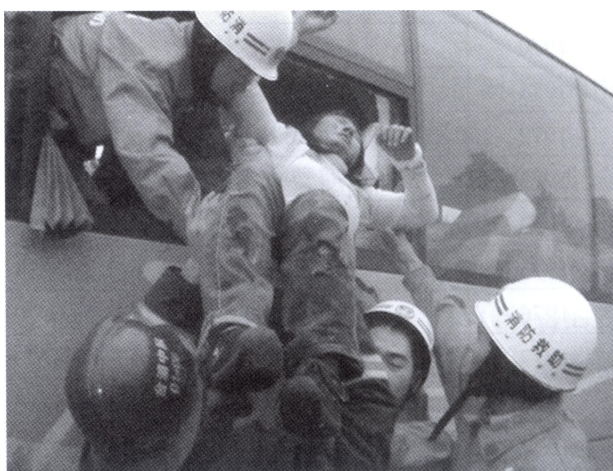
2007年4月8日，合山高速公路车祸抢险救援现场

2007年，共接警出动141次，出动车辆139次，警力1239人次，其中灭火20次，抢险救援121次，抢救人员40人次，灭火救援和抢险救灾成功率达100%。