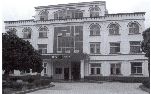
西场边防派出所办公楼