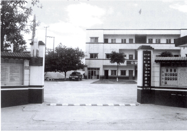
党江边防派出所大门