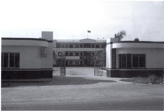
山口边防派出所大门

白沙边防派出所为二级公安派出所，自建所以来，加强边防派出所的全面建设，实行规范化管理，预防和查处各种案件，维护了辖区社会治安大局的稳定，取得了较好的成绩。1980年和1984年分别被钦州地区边防支队评为全民文明礼貌月先进单位和业务建设考核第二名；1981年、1985年、1986年分别被钦州地区公安处评为先进单位、公安保卫先进单位和授予集体嘉奖的先进单位；1982年被钦州地区评为公安系统精神文明建设标兵单位；1984年被广西边防总队评为安全无事故先进单位；1987年被县公安局评为先讲单位；1989年和1991年在县边防大队船管工作评比中分别获得第二名、第一名；1991年被县人民政府评为社会治安综合治理先进单位，1993年被县人民政府授予集体三等功；1994年被县公安局评为先进单位；1996年被北海市公安局授予集体嘉奖；1997年被自治区公安厅边防局评为边防派出所业务基础建设达标单位；1998年和1999年分别被县公安局授予集体嘉奖和评为先进单位；2000年被北海市边防支队评为营区管理先进单位；2003年被自治区公安厅评定为二级公安派出所；2005年被广西边防总队评为先进党支部和先进基层单位。