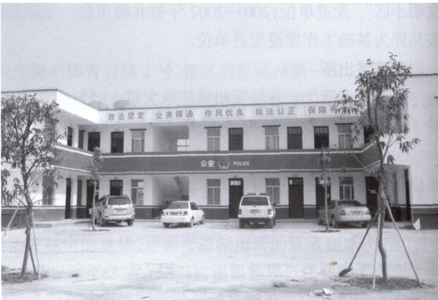
清江派出所新办公楼

清江派出所为二级派出所，自建年以来，刑事案件逐年下降。2000年立刑事案件58起，2005年下降到40起；破案率稳步上升，2000年破案率为53.4%，2005年破案率达到72.5%。禁毒工作和构建治安联防组织网络的做法得到上级业务部门的肯定。2000~2002年，清江派出所共获得市、县、镇立功、嘉奖5次，其中2000年获得廉州镇两个文明建设先进单位奖；2001年度荣立县“严打”整治斗争集体三等功；2002年分别获得县公安局集体嘉奖和北海市社会治安综合治理先进单位奖。1999~2005年，全所先后有荣立个人三等功4人次；获自治区综合治理先进个人奖1人；获县公安局嘉奖18人次。