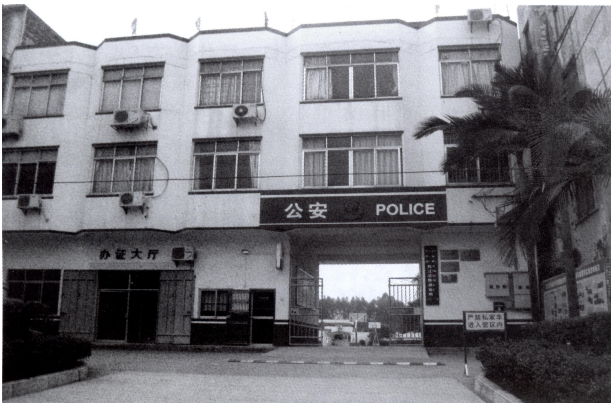
乾江边防派出所大门

乾江边防派出所为二级公安派出所，自组建以来，全力推进规范化建设，构建防范和打击各种犯罪活动的治安体系，维护辖区的社会治安秩序，成绩显著。2004年，乾江边防派出所获合浦县委、县政府授予“合浦县严打整治集体嘉奖”。2005年10月和12月，2次获得县公安局的集体嘉奖。2004~2005年，全所有1人被广西边防总队记三等功1次；1人被广西边防总队授予“先进工作者”称号；2人被广西边防总队授予“优秀警官”称号；1人获合浦县委、县人民政府嘉奖；2人获北海边防支队嘉奖。