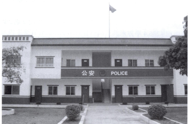
沙岗边防派出所办公楼