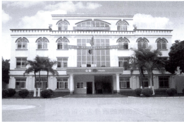
白沙边防派出所办公楼