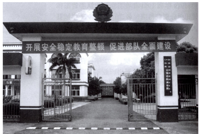
公馆边防派出所大门