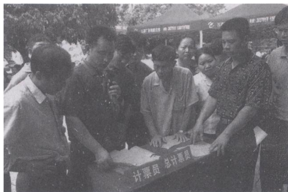
银海区村民委员会换届选举现场

举产生新一届班子。试点工作成功后，1999年4~6月，在全区46个村（居）委进行换届选举工作。共选举产生主任46人，副主任51人，委员117人。主任中有4人是女性，副主任中有10人是女性，委员中有44人是女性。主任中最大年龄