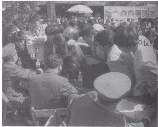
银海区驻区部队开展便民活动