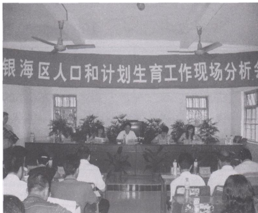
银海区计划生育工作会议现场

1984年9月北海市郊区恢复成立前，北海市银海区（郊区）境内的计划生育工作由北海市计划生育委员会负责。1984年9月设置郊区计划生育办公室，配备专职工作人员4名。1988年6月郊区计划生育办公室更名为郊区计划生育委员会，配备专职计生干部4人。1993年5月成立郊区计生稽查队，配备队员9人，由郊区计生委直接管理。1995年初，撤销郊区，成立银海区。设银海区计划生育委员会，定编7人，实有工作人员7人。原郊区计生稽查队更名为银海区计生稽查队。1997年12月，设银海区计划生育服务站（临时事业机构），配备工作人员4名。1998年12月银海区计生稽查队撤销。2002年1月，区计划生育委员会更名为区计划生育局，定编4人，实有工作人员7人。同年12月，区计生服务站撤销，其相关职能并入区计生局。镇级设立计划生育服务所（管理站），各村（居）委会配备有专职计生专干，村（居）民小组配备有人口管理员。区、镇、村（居）三级均建立有计划生育协会。2002年末，区、镇、村三级专职计生工作人员87人，其中区7人，镇33人，村47人。村（居）民小组人口管理员640人。