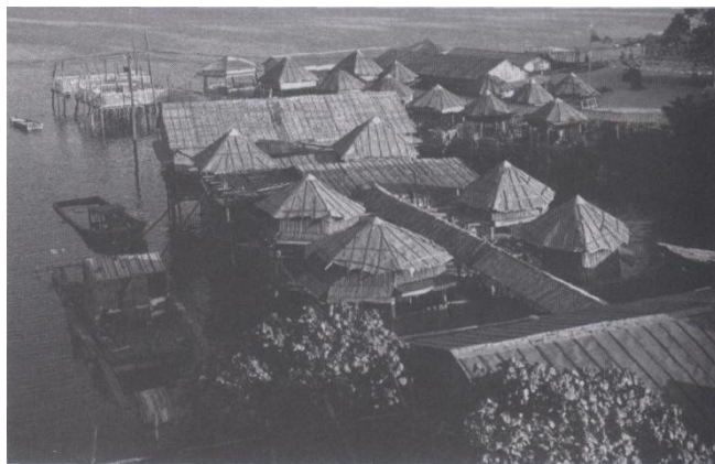
滨海渔家风情村一角

海洋馆占地面积11000平方米，建筑分3层共12000平方米。展示主题包括“沧海桑田”、“大自然的奥妙”、“人类与海洋”、“深海猎奇”等内容，通过声、光、电等高科技手段造景，再现珊瑚、贝类等海洋生物的生存环境，在技术上超越国内众多海洋馆以海洋鱼类为主题的陈旧模式，创新以海底绚烂的活珊瑚和贝类为展示主题，从而开辟海底探秘一个新的窗口。整个馆共设9个展厅，分别是生命的起源、和远古海洋生物的对话、生命的长廊、南海水下世界、滨海景观、贝类与贝壳艺术、海洋资源、人类开发海洋的历史和深海探奇等。展出的贝壳标本品种达600多种近7000枚、活海贝70多种、活珊瑚150多种以及100多个品种的海水观赏鱼。馆内还没有4D动感影院、多媒体学习、互动性的给鱼类喂食的游戏、潜水艇体验区和“海盗藏宝”游戏等项目。