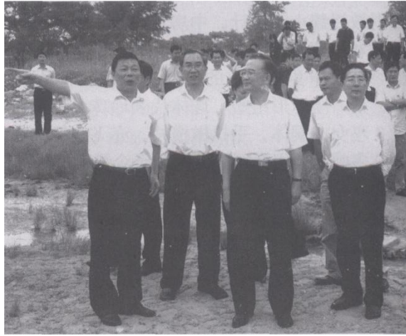
2008年9月，国务院总理温家宝到北海银滩视察

手工艺品村、高科技设计中心、海洋中心和海洋生物馆、人与自然博物馆、专业运动医院和影剧院设施等12类，规划分为41个区块，总建筑面积为982.5万平方米。