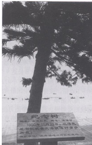
江泽民总书记于1990年11月23日在北海银滩亲手种下的纪念树

北海银滩，拥有高高墩、古里寨、南漓古港、海上丝路等丰富的历史文化及古迹，又流传着白龙、白虎和金凤化成滩的系列民间传说。相传长达50里的银滩是南海龙王大儿子白龙太子和天上的白虎星君躯壳化成，而银滩沿岸上的大片木麻黄林带又是白龙太子的情人金凤姑娘抖落的羽毛化成，白龙太子与金凤姑娘相慕、相恋、相爱最后结合于情人岛上。婚后犀牛精捣乱影响了“廉州好妹仔”的主唱和水族们“海角听涛声”的和声，气走金凤，激怒白龙，至使白龙太子踢死犀牛，改土成湾及怒穿凤山，开凿鸳鸯湖等系列行为而被玉帝谪下凡间化成银滩。其好友白虎星君高枕虎头守候白龙，怒视犀牛岭而形成白虎头。千百年来北海银滩的名称均叫“白虎头”、“高沙龙”或“龙虎银滩”。