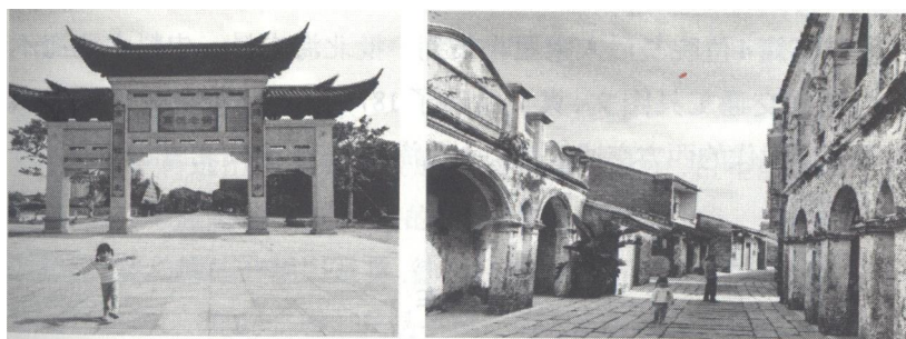
新修建的高德三街广场（左图）、高德老街新貌（右图）

伫立在高德老街，忽想：这一切变化，这一切实现，不更应典藏到更宏大、更权威、更有历史见证力的博物馆、图书馆中去么？！