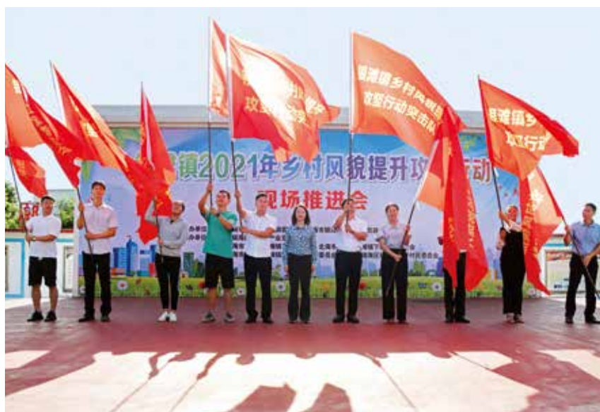
2021年6月20日，银滩镇2021年乡村风貌提升攻坚行动现场推进会在银滩镇下村召开。

【生态保护】 2021年，银海区全力以赴抓好卫片图斑、海洋督察事项整改工作，第二轮中央环保督察组反馈问题整改取得阶段性成效。全区空气优良率 95.9%，近岸海域水质达标率 100%，土壤环境安全稳定。完成银滩中区岸线生态整治修复，实现咸田港退港还滩，冯家江环境治理项目入选中国特色生态修复十大典型案例。12月6日，北海市水上安全隐患大排查大检查大整治专项行动公开拆解销毁涉渔“三无”船舶现场会(银海区分会场)召开，银海区公开