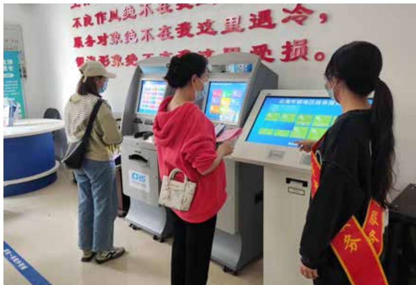
2021年3月2日,区政务大厅一楼工作人员指导群众办理医疗保险缴费信息查询业务。

【政务服务便利度提升】 2021年,银海区的依申请政务服务事项进驻率、全程网上可办率、一窗受理率等均达到100%。通过帮办、代办的形