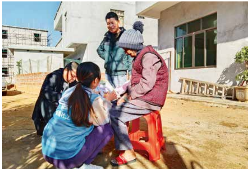
2021年12月8日,区民政局工作人员到福成镇红旗村走访慰问困难户。

【概况】 2021年,北海市银海区人力资源和社会保障局(简称区人社局)坚持以习近平新时代中国特色社会主义思想为指导,全面贯彻落实中共十九大和十九届历次全会精神,完成全年各项工作任务,并取得明显新成效。年内,区人社局选派业务能手参加北海市、自治区比赛分别获得团体二等奖及“人社知识通”称号,队伍的服务能力和水平得到大幅提