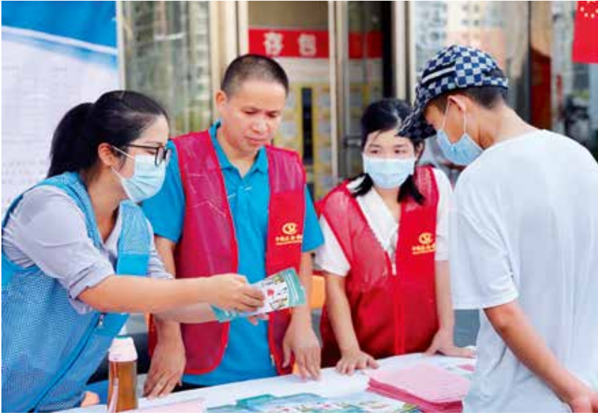
2021年国庆节期间,区人社局在万达广场开展“金秋迎国庆,社保暖人心”系列宣传活动。