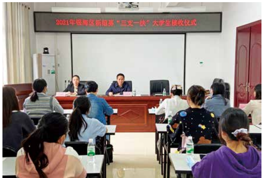
2021年10月18日,银海区新招募“三支一扶”大学生接收仪式举行。

农民2182人,符合参保条件的被征地农民2137人,其中参保缴费1703人,领取待遇319人;参保率94.62%,完成上级下达的90%参保率的目标任务。机关事业单位在职参保人数2943人,完成上级下达目标任务的115.82%;社会保障卡上传持卡库持卡人数15.70万人,完成上级下达目标任务的104.19%。按时足