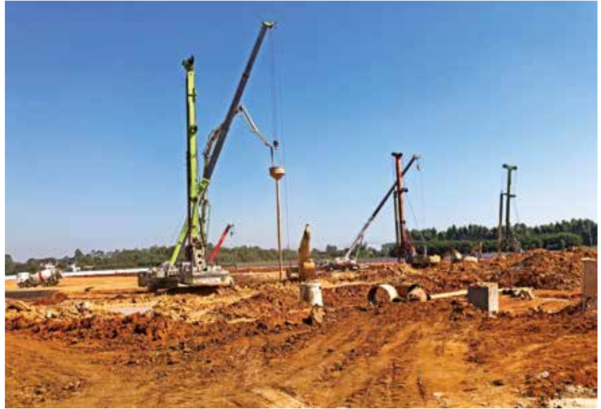
2021 年 12 月 6 日,银海区福成产业园项目施工现场。

银海区福成产业园基础设施建设项目征地工作 银海区福成产业园基础设施建设项目属于自治区统筹推进的重大项目。2021 年,银海区全力推进银海区福成产业园征地搬迁和基础设施工作。年内,完成 61.2 公顷土地征收(收回),完成率 100%;完成 57.87 公顷青苗及地上附着物补偿,完成率 94%;清场 57.87 公顷,完成率 94%。按时交付项目业主施工建设,助力银海区产业发展和招商引资平台落地建设。