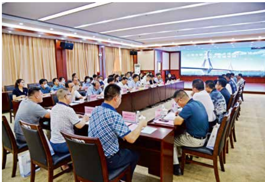
2021 年 8 月 25 日,银海区召开“政企连心”座谈会(房地产领域专场)。

【共建自然资源管理合作签约仪式】 2021 年 2 月 25 日,银海区人民政府和广西国土资源规划设计集团公司举行共建自然资源管理合作签约仪式。双方就项目合作、资源共享、决策咨询等方面深化合作进行了充