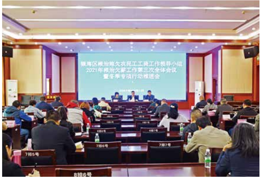
2021年12月1日,银海区召开根治拖欠农民工工资工作领导小组2021年根治欠薪工作第三次全体会议暨冬季专项行动推进会。

署会、2021年根治欠薪工作第二次全体会议暨迎接国务院考核部署会、2021年根治欠薪工作第三次全体会议暨冬季专项行动推进会,积极有序推进全区根治欠薪工作,主动协调加强日常监管检查,加强辖区根治拖欠农民工工资联合执法。年内,全区共协调处置各类涉嫌欠薪的突发事件82件,未发生“因欠薪引发的50人以上重大群体性事件、因欠薪引发的极端事件、政府投资工程项目欠薪案件”等一票否决的3个严禁问题。全年检查用人单位370家,检查在建项目109项。坚持对项目企业常抓常严,区治欠办组织行业主管部门对在建工程项目进行日常检查,督促项目单位认真落实工程项目根治欠薪监管责任制、项目监管责任人制度,严格按照项目监管责任制进行监管,按要求实行“人盯人、人盯项目”和包干解决,确保各在建工程项目“一金七制度”贯彻落实到位;