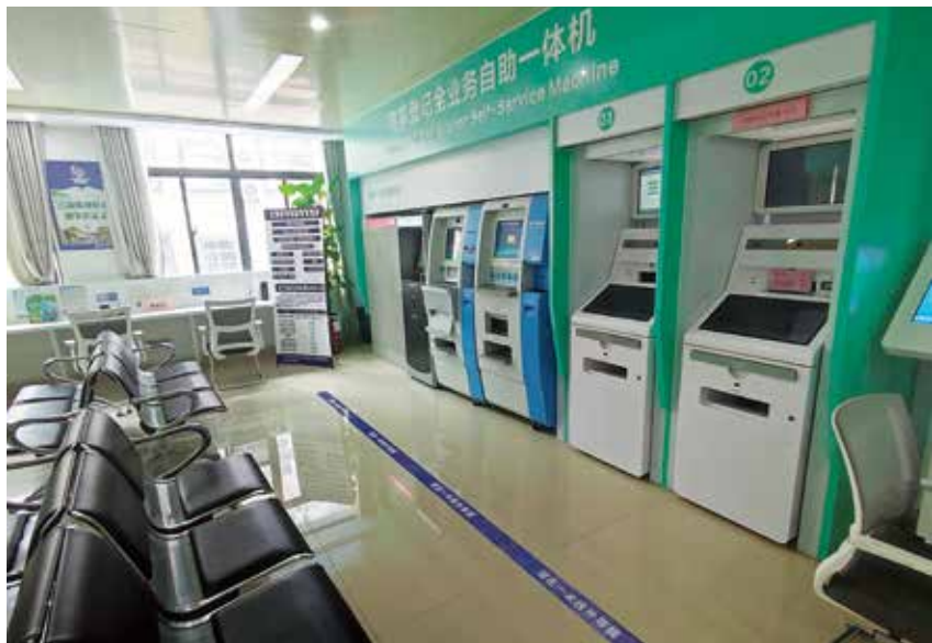
2021年8月9日,区政务服务大厅摆放的商事登记全业务自助一体机。

办理。区政务服务中心设独立窗口30个,其中统一收件窗口1个、就业窗口1个、社保窗口4个、医保窗口3个、保险窗口1个、市场监管窗口5个、税务窗口2个、刻章公司窗口2个、银行窗口1个、水电气窗口1个、区农业农村和水利局窗口1个、区自然资源局窗口1个、区民政局窗口1个、区教育局窗口1个、区残联窗口1个、区发改局窗口1个、区城市管理和交通运输局窗口2个、区卫健局窗口1个。全年办件受理6.25万件,办结6.26万件(含上年受理办结件),未出现超时办件及被投诉的现象。