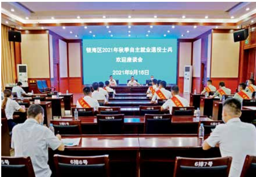
2021年9月18日,银海区2021年秋季自主就业退役士兵欢迎座谈会召开。

役军人事务局注重面对面谈心,贴心服务,为到访的退役军人和军属提供优质服务,为他们解决各种问题。