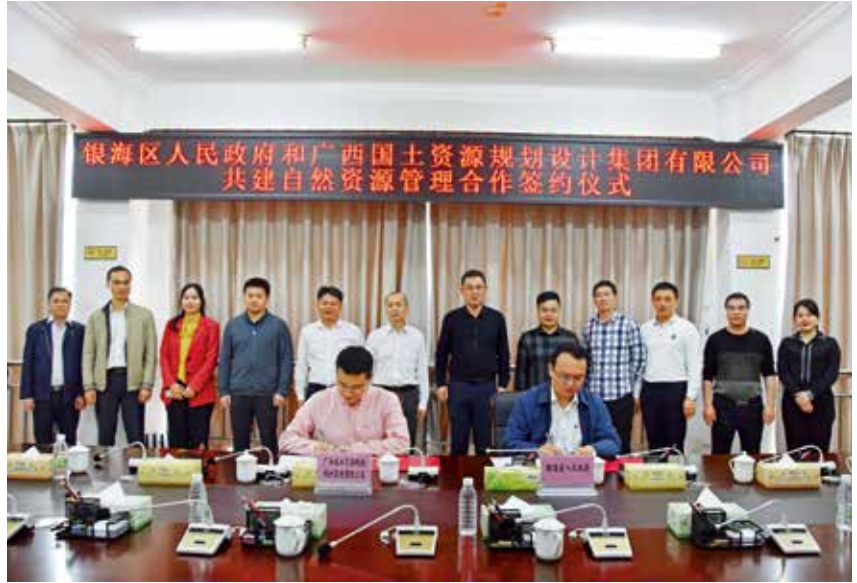
2021年2月25日,银海区人民政府和广西国土资源规划设计集团公司共建自然资源管理合作签约仪式举行。 区政府办供

【土地承包经营权流转交易签约仪式】 2021年3月20日举行。银海区成功与广西安农农业集团和福成镇红境塘村股份经济合作社签订62.93公顷土地流转合同,与广西青茂农业科技有公司签订33.33公顷的土地流转意向书。