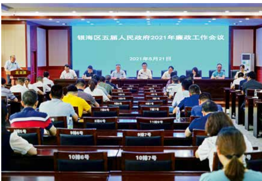
2021年5月21日,银海区第五届人民政府召开廉政工作会议。