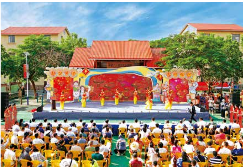
2021年11月6日,以“庆丰收感党恩 勇奋进促振兴”为主题的银海区庆祝中国农民丰收节活动在福成镇宁海村委平新一村举办。

【社会保障】 2021年,银海区实施民生类项目26个,完成投资约15亿元。超额完成城镇新增就业、失业人员再就业任务。全区城镇登记失业率1.9%,为历年最低。城乡养老保险入库参保率95.4%,缴费率83.7%,参保缴费率排名北海市第1名。落实被征地农民养老保险政策,大力推进5个重大项目,是全市推进力度最强的区。城乡居民医保参保率98.4%,脱贫人口、农村低收入人口100%参保。率先在全市落实依申请救助制度、挂牌成立镇级未成年人保护工作站,全力做好社会保障兜底工作。城乡最低生活保障标准持续提高,城市低保标准从每人每月850元提高到1000