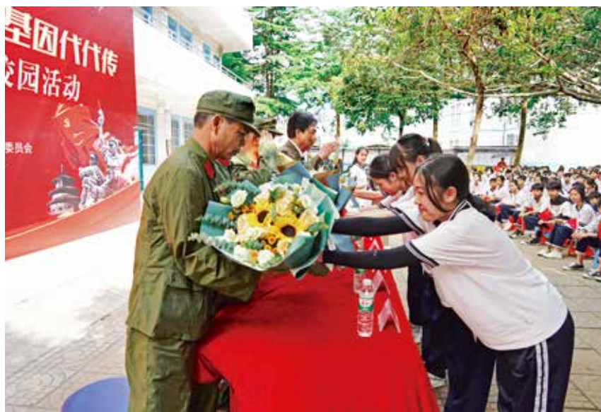
2021年4月22日,区退役军人事务局联合北海市双拥办等有关单位到福成中学开展“学党史 跟党走 红色基因代代传”爱国主义教育进校园活动。

【信访维稳工作】 2021年,区退役军人事务局做好对参加边境自卫反击战人员及相关重点人员专访调研工作,做好因新冠肺炎疫情疫情防控工作影响改变