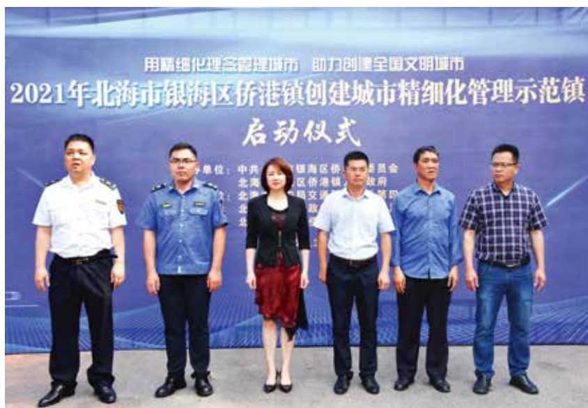
2021年3月30日，北海市银海区侨港镇创建城市精细化管理示范镇启动仪式在侨港镇举行。

等背街小巷 11 条。贵阳市场被评为广西示范性农贸市场，侨港镇背街小巷被列入自治区背街小巷环境整治工作现场推进会观摩点。投入 4000 万元建设环卫基础设施，新增垃圾分类亭、果皮箱 1700 余个，侨港镇成为全市生活垃圾分类示范镇。投入 550 万元完成 5 千米农村公路路面提升工程，投入 1590 万元完成 3.8 千米高德至南康公路改建工程。投入资金 6123 万元，完成 238 个全域基本整治型村庄、1 个精品示范型村庄建设以及 1143 栋农房风貌塑造。投入资金 1861 万元，建成“一事一议”财政奖补及美丽乡村项目 67 个，农综改工作连续 5 年获评自治区“优秀”等次。打造赤东村、平新八一村、石桥塘村等乡村振兴示范村，平新八一村被列入澜沧江—湄公河地方政府合作论坛和自治区水库移民易地安置培训会现场参观点，石桥塘村被评为广西乡村旅游重点村。