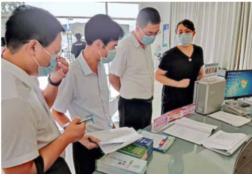
2021年9月17日,区长郭彦江(右二)到区政务服务大厅指导工作。