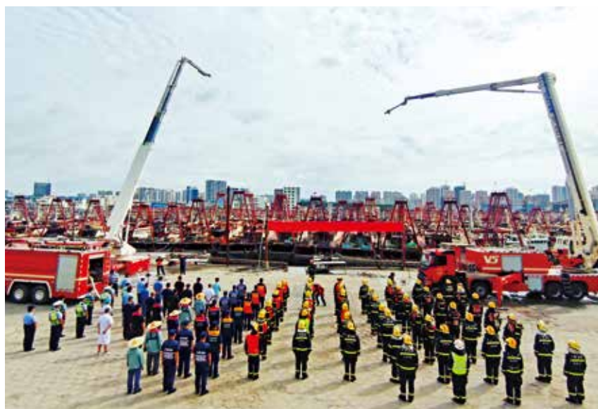
2021 年 6 月 30 日,区消防救援大队在侨港镇电建渔港边贸码头开展 2021 年休渔期渔港渔船火灾应急救援联合演练。

消防安全专项整治 2021 年,区消防救援大队聚焦火灾高风险区域,统筹部署开展消防安全专项整治三年行动,配套部署对自建房、商场市场等