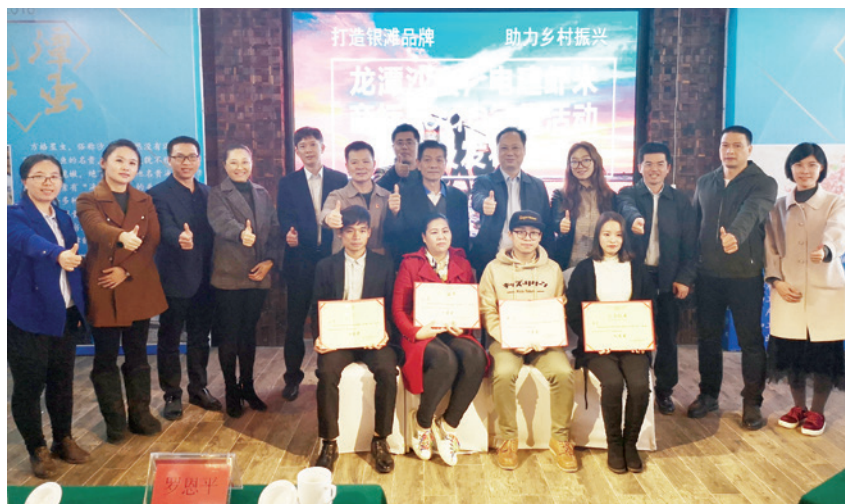
2018年1月24日,银滩镇在海滩大酒店北海厅举行“龙潭沙虫、电建虾米商标LOGO征集活动”颁奖及发布仪式 银滩镇政府 供