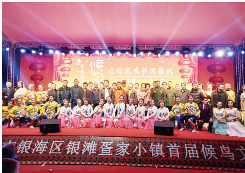
2018年2月10日,北海市银海区银滩蛋家小镇首届候鸟文化艺术节“三天三夜·乐在北海”在北海银滩蛋家小镇举行。图为闭幕式