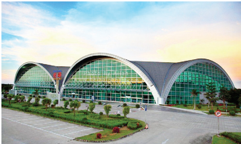
2018年,北海福成机场航站楼一角

“雨露计划”补助191人33.35万元;为13名优秀贫困女童联系到4名爱心帮扶人,资助金额7000元。投资84万元的山梓村等3个扶贫光伏发电项目建成并投入使用,每年为每个贫困村带来集体经济收入3.5万元以上。推行“党组织+合作社+贫困户+基地”等脱贫攻坚模式,积极动员社会力量参与,筹集社会扶贫资金共20多万元,凝聚合力脱贫攻坚。加大村屯硬化道路修建力度,千方百计做好建档立卡贫困户危房改造工作,推进贫困户转移就业、落实相关政策,抓好建立风险保障机制,积极改善贫困村、贫困户的生产生活条件,助推脱贫攻坚工作更加精准扎实开展。年内,全镇完成预脱贫户148户608人脱贫和山梓村脱贫摘帽任务,辖区内3个贫