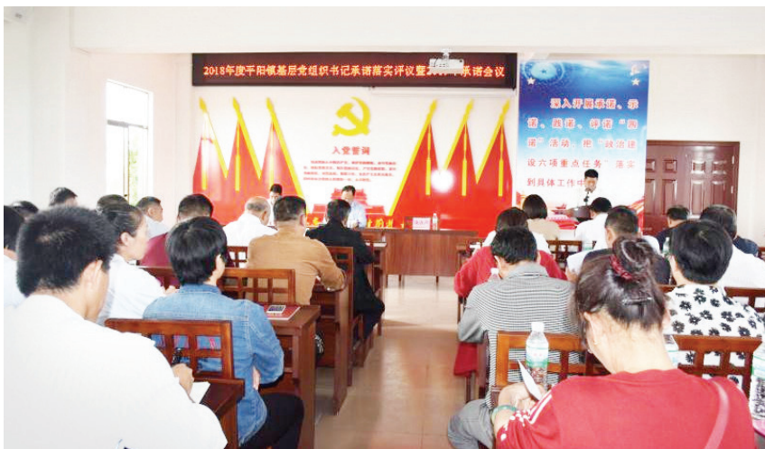
2018年, 平阳镇政府在平阳村委召开2018年度平阳镇基层党组织书记承诺落实评议暨2019年承诺会议, 开展评选“最佳承诺”活动