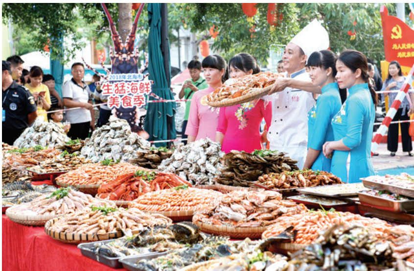
2018年9月9日,侨港百米长桌海鲜豪门盛宴上展示的各式美食