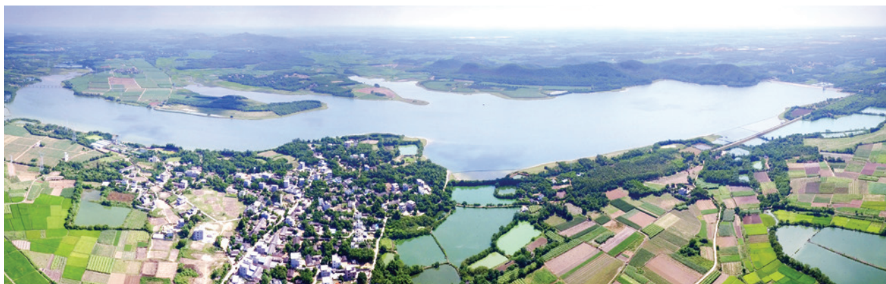
2018 年,平阳镇孙东村及牛尾岭水库全景