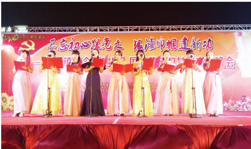
2018 年 3 月 7 日,银滩镇纪念“三八”国际劳动妇女节文艺晚会在银滩登家小镇举行 银滩镇政府 供

【民生和社会事业】 2018 年,银滩镇规范发放高龄补助、贫困重度残疾人生活救助及轮椅、拐杖等辅助器。城乡居民养老参保率和缴费率分别达到 90% 和 84%,新城乡居民医保参保率达 97%。城镇登记失业率控制在 3% 以内。完成农村劳动力 372 人转移就业,培训劳动合同签订率达 100%。落实计生家庭免费城镇医保 3016 人、城镇养老保险 1003 人、爱心保险 1137