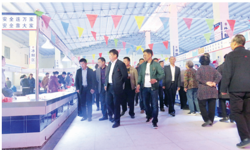
2018年1月18日, 蛋家小镇首批惠民工程——海欣菜市场开业, 可提供上千名回建区群众就业

人, 发放计生家庭独生子女保健费 3.76 万元。完成夏秋季征兵工作。积极开展关爱妇女儿童活动, 镇妇联被北海市妇联评为“优秀基层单位”。举办“情暖乡村同欢乐”文化惠民演出 10 场, 组织贵兴社区文艺队参加自治区 60 周年大庆基层文艺汇演。银滩镇参加“迎大庆、颂党恩、赞北海”银海区合唱比赛获“一等奖”。银滩镇海兴社区、下村村、和平村、新村社区通过自治区社区减灾准备认证。为符合条件的 136 户群众办理入住公租房。