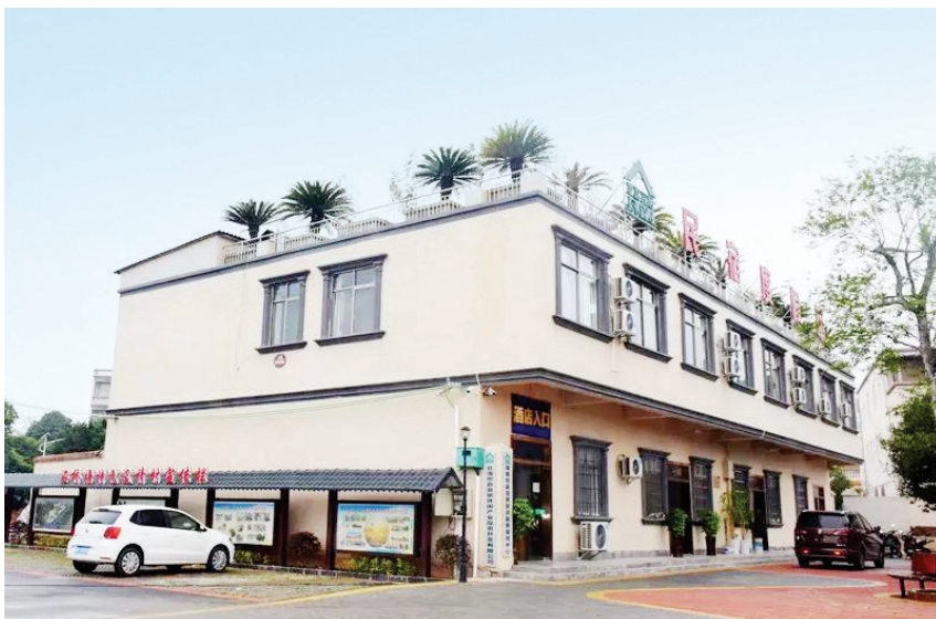
2018年, 新建成的平阳村委石桥塘村民宿外景

发展乡村旅游, 壮大集体经济, 吸引广西区内外多个考察团前往考察学习, 发挥平阳村党组织全国创先争优先进基层党组织引领作用。把平阳村、东山村打造成自治区“五星级党组织”, 巩固提升横路山村自治区“四星级党组织”。发展村集体经济成效显著。成功建成东星村东鸿大棚种植基地、东山村民族幼儿园、石桥塘特色民宿及商铺项目、赤东龟鳖养殖合作社等壮大村集体经济项目, 落实乡村振兴战略。年内, 镇辖7个村集体收入全部超过5万元, 50%以上的村集体收入超10万元, 个别村集体收入由原来的零收入增加到10万元以上, 摘掉集体经济“空壳村”帽子。