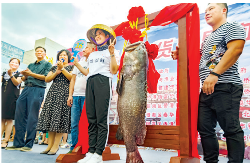
2018 年 8 月 18 日,侨港镇渔货市场开市暨头鱼拍卖活动。图为重 76 千克的龙趸鱼拍卖现场

【民生事业】 2018 年,侨港镇为 151 户普通家庭发放困难补助 46.14 万元;为 56 户低保边缘户发放补助 20.51 万元;为原参加渔业生产集体劳动、达到 60 周岁的老归侨 348 人发放每人每月 200 元的生活补助;春节走访慰问特困户、低保边缘户、低保