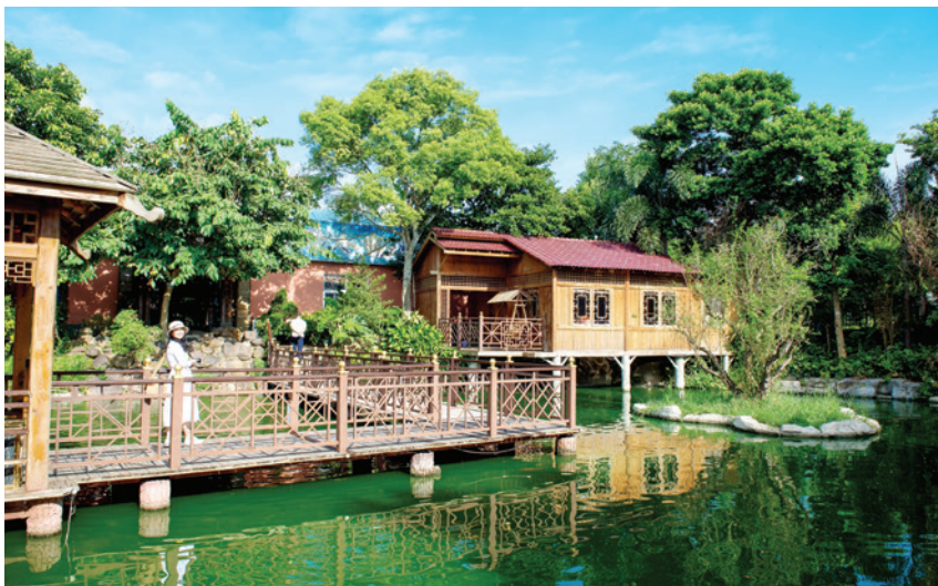
2018年, 平阳镇平阳村委村民开发的乡村旅游之民宿项目风景优美