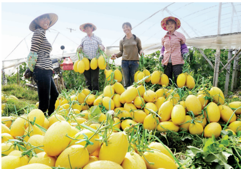
2018年秋分时节,福成镇瓜农在采收哈密瓜

订福成镇乡村振兴战略决定、方案并组织实施。指导新申报实施项目16个(总数达35个),发展类型包括种养、资产出租、合作经营等多种模式,把村集体经济融合到地方特色产业发展中,推动产业转型升级,实现各村集体经济收入均达5万元以上。组织实施产业扶贫乡村振兴项目18个,充分发挥当地龙头企业和经济能人的带动帮扶作用,助推产业扶贫和乡村振兴产业兴旺。组织规划村庄居住区、甘蔗保护区、现代特色农业发展(大棚种植)区、乡土特色产业发展区。推进建设产值超亿元哈密瓜产业化,规划发展福佬塘火龙果、百香果等特色农业产业孵化基地,福成宁海农业综合产业基地,山梓现代果蔬产业扶贫基地,畔塘和红境塘甘蔗机械化种植示范基地等重大示范项目。成立哈密瓜产业分会,筹措资金20万元以上举办生态乡村旅游文化节、哈密瓜采摘暨庆农民丰收节。深入群众召开动员培训会5次、走访400多户村民调研推进土地整合流转,已整合和正