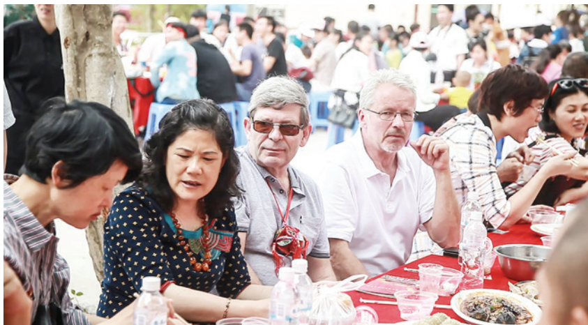
2018 年 4 月 18 日,平阳镇在石桥塘村举办 2018 年“壮族三月三·八桂嘉年华”民俗文化旅游节和壮瑶特色佳肴长桌宴活动,吸引中外游客约 5000 人参加

面前垌 1000 米灌排渠、孙东村无公害蔬菜生产基地 8000 米排灌渠建设,解决农业生产排涝、灌溉问题。完善各村公共服务中心、农家书屋、儿童家园、文体场所等村级文化阵地建设,不断满足农民群众日益增长的精神文化需求。完成村民改厨 400 户、改厕 402 户,改善农村居住环境,提高群众生活质量。