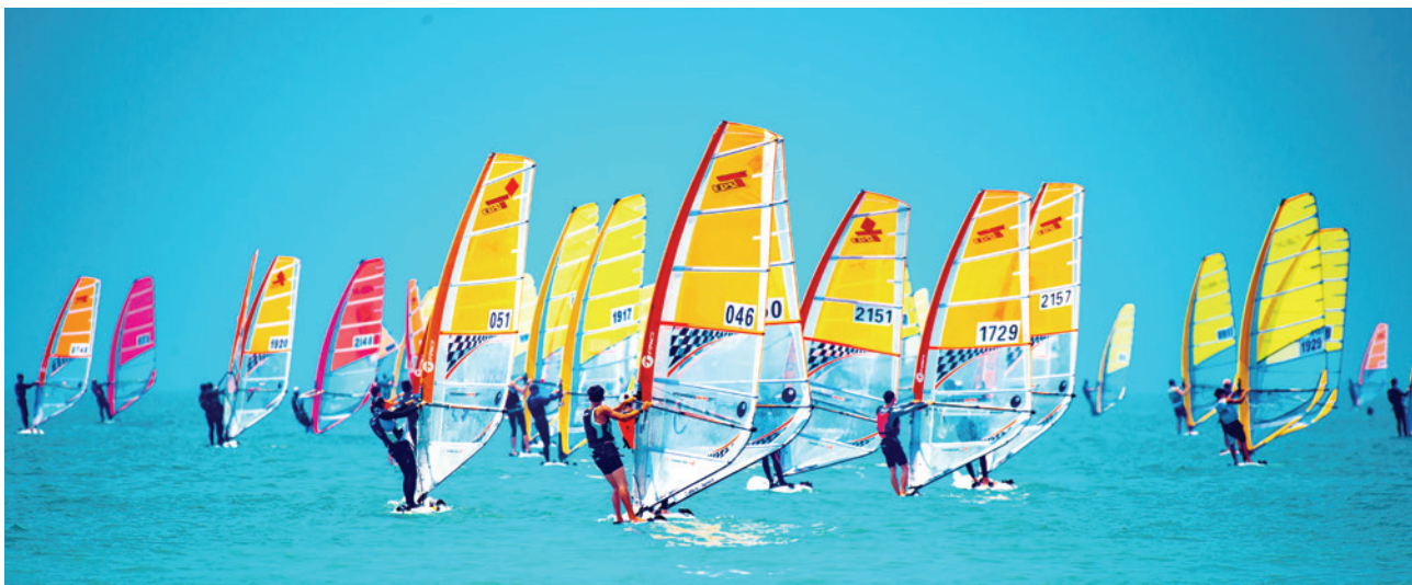
2018年12月9日—16日,全国OP帆船冠军赛在侨港海滨浴场举行