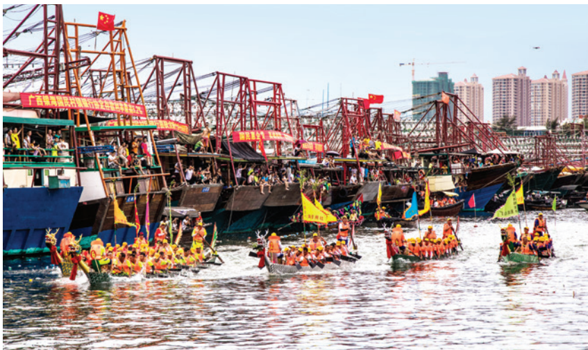
2018年6月18日,北海市银海区全域旅游端午“侨港风情”文化艺术节侨港龙舟赛现场

多个4000多人次;夯实“一连十、十连百”联系帮扶机制,把服务大厅的服务功能延伸到店铺和渔船,把临时性帮助变为常态化帮扶;深化“两学一做”学习教育常态化制度化。党员服务队每月实施“三个二次”参加夜巡活动,全年不休协助开展街道整治、渔港航道疏通等活动250多次,参加活动的党员近4000人次。建立“海上党旗红+警务”机制,把“党建+警务”建在渔船上,从陆地向海上延伸,创新