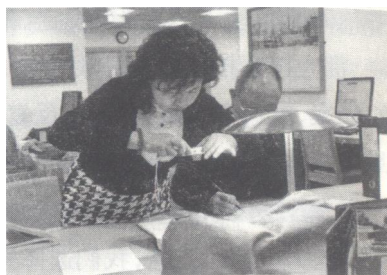
2011年2月,本书作者在英国伯明翰大学档案史料馆收集北海史料情形

返回北海整理这些史料期间,发现北海麻风基金会档案典藏在伦敦市档案馆。这一史料可认证北海是不是中国首家麻风医院。因该史料藏在另一机构,需再次莅临查找。