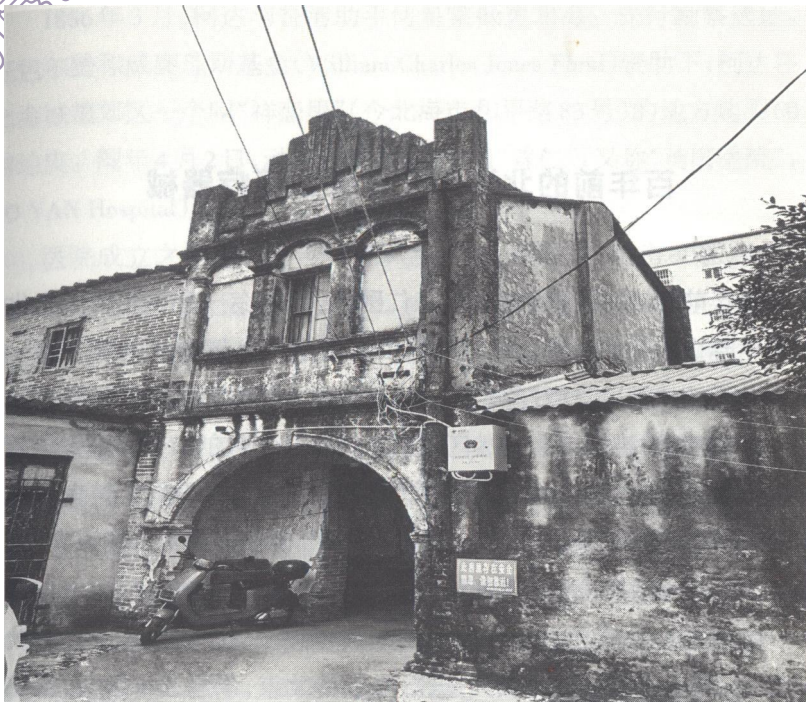
用北海普仁医院普通医生住宅楼改造的北海第一家电影院——明园电影院入口

在电影院入口前环顾四周，东邻的是百年北海普仁麻风医院遗址，东南方不远处是北海明园电影院开办者顾银先生曾经住过的地方——普仁医院高级医生楼，周边的古树，枝繁叶茂……透过这些珍贵的历史遗存，可依稀看见北海第一家电影院当年热闹非凡，听它述说90年前电影院和早期电影这一新兴的文化产业进入北海，给这座城市带来的荣耀与变迁。