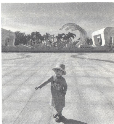
新改造的北海银滩欢乐港湾区广场

自世界各地的 44 家设计机构报名，中国城市规划设计院、美国莫里斯建筑设计公司、莫斯科文化旅游休闲体育保健建筑设计研究所设计的方案被选中。当设计方案在市图书馆展出，超过 3500 名市民参观、评议了方案。北海市民关注银滩的热情可见一斑。最终美国莫里斯建筑设计公司以“珠链式”的设计理念受到了众多专家和市民的青睐。最终有了按国际一流水准、规划设计、按世界名滩要求改造升级的《银滩旅游区（中区）改造一期工程工作方案》，经自治区政府批准，实施“6+N”项目建设：北海银滩“潮”雕重建工程；“潮”雕广场环境提升工程；潮街（原北海银滩四号路）整治改造提升工程；北海银滩旅游基础设施建设工程；北海市（北部湾）旅游集散中心（一期）项目；银滩“潮”广场大门工程、北海银滩中区（电建港—原咸田港段）岸线综合生态整治修复；咸田港还滩自然岸线恢复项目、北海国际客运港航道扩建工程；北部湾国际海洋旅游服务基地（一期）项目；高星级酒店项目。