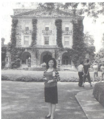
2012年6月19日，本书作者与“西方医学在中国，1800—1950年”项目组成员参观洛克菲勒庄园留影

6月19日清晨，威廉博士陪同与会人员一行乘地铁、坐火车，前往洛克菲勒庄园和洛克菲勒档案中心。洛克菲勒这位著名的石油大亨与中国有悠久的历史渊源，洛克菲勒基金会在中国建立了北京协和医学院及其他一些医学机构；至今，仍资助北京协和医院、湖南湘雅医院的学者来美国洛克菲勒档案中心进行为期3个月时间的历史研究工作，可见这一基金会在倾心倾力传播文化文明上的不竭努力。