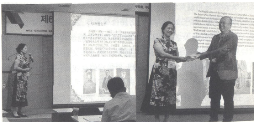
2018年8月8日下午，本书作者在第6届中韩医史学术会议上做研究报告，并将研究成果《中国首家麻风医院：北海普仁医院医史再发现》一书赠予韩国延世大学医学史研究所负责人

8月8日下午，按大会日程安排，笔者在会上做报告，先前会上已经有25位中韩学者进行了报告，其中中方15位，韩方10位。各位学者的报告视角独特，切入点别具风格，既有针对近代医学人物、医学知识和技术、医疗制度的研究，也有在政治、社会、文化脉络下探讨医学与医疗之影响与意义的医疗社会史、新文化史的研究。我是最后一位报告者。报告能打动与会者吗？数次登上国际学术会议讲台的历练，家乡悠久丰厚的医史，这都给了我勇气、信心。在讲台上，打开用20张图片、史料，精心制作的图文并茂多媒体课件，从伍连德生平、伍连德与北海医史考略、结论等三个部分把研究成果清晰表达出来，让与会专家学者了解伍连德与北海医史的渊源及对我国防疫的贡献。了解近代北海医疗的发展水平。将带去的研究成果《中国首家麻风医院：北海普仁医院医史再发现》赠予韩国延世大学医学史研究所，从会议参会专家的提问中，感受到北海医史格外受到重视，北海医史与现代医学发展的内在联系且广又深，是医史的丰富宝库，北海医史的学术影响力漫向全国。