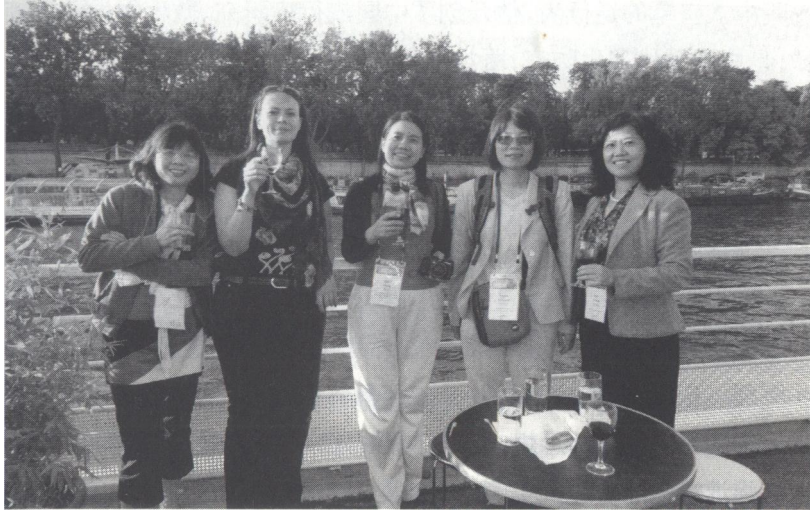
2015年7月11日下午，“第14届东亚国际科技医学历史会议”安排与会专家学者考察法国塞纳河， 本书作者与与会学者合影

庚大学、台湾中央研究院、香港教育学院和北京大学的学者。美国 LMACOLLEGE（阿尔玛学院）历史系主席兼教授卜丽萍说：“我要认识您，您给我一张名片。”法国国家科研中心访问学者阮洁卿博士说：“我喜欢这部书，我去买好了。”她们的话令人感动。从中感受到了各国专家学者对中国北海历史文化和北海普仁医院百年史料的钟爱。