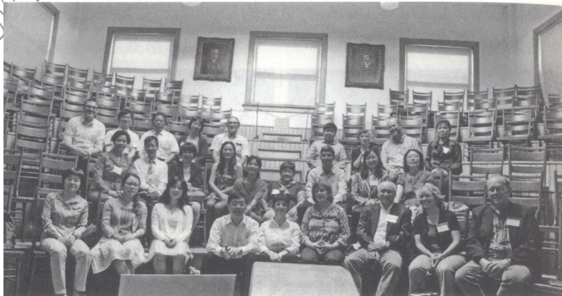
2012年6月16日下午，与会代表参观印第安纳大学医学历史博物馆留影

6月16日下午，与会人员在威廉博士的陪同下，又去参观印第安纳大学医学历史博物馆。这次参观重在看建筑、看该馆历史陈述，看馆藏的实物。该馆是用1895年Davis和Edenharter博士设立的卡森（奥斯特曼）管理委员会的病理学研究室改建而成。那是一栋三层楼的建筑，进门一边是阶梯教室，教室黑板上书写的“1895年”字迹醒目，向人们昭示它的悠久历史。一边是人体解剖实验室，存放着一张百年前使用的解剖台、解剖器械、冷藏遗体的冰柜、捐献遗体人的照片。二楼是病理室，藏品包括人体器官标本和不同年代生产的显微镜、人体组织切片机、各种化学药物和器皿。三楼收藏各种庞大笨重的古老照相机。