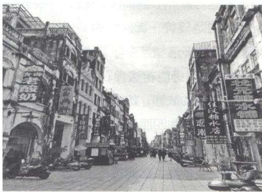
北海老城“中西合璧，廊柱骑楼”珠海路老街

北海港为合浦大动脉南流江出海口，汉武帝时期，与徐闻港同为“海上丝绸之路”的起点，南流江内可同珠江水系而接长江流域，亦是西南三省最近的出海口；外则近接越南、新加坡等国，成为最早与南亚海上来往的古港，历朝与“外夷”交通的孔道。咸丰年间大成国起义影响梧州口岸的阻塞，西南各省及广东、广西腹地货物改道北海外流；加上港阔水深无礁不冻等优越条件，由此书写了北海百年前对外开放的历史沧桑。