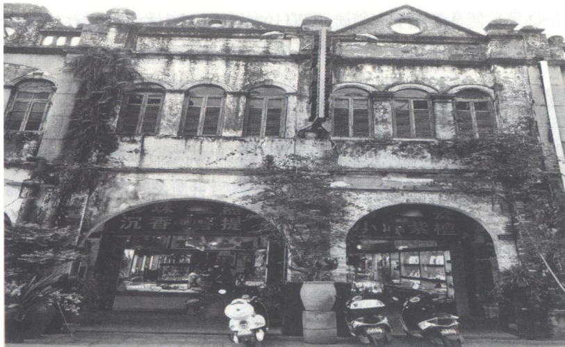
1892年英国大英传教会在北海老街创办的教堂和男子学校，1902年北海普仁医院创始人英籍柯达医生将其装修为北海普仁医院老街诊所旧址（位于今珠海中路32号）

人物和事件也许会随着岁月而渐渐离去，但作为一段历史却永远不会断流。“欧风东渐”北海这段历史自然如此。它不仅记载史册，当今还藏存在这两幢西洋建筑物中，镶嵌在一砖一瓦里。百年后的今天，普仁医院老街诊所，男子学校、讲道堂经历风雨洗礼，世事变幻，早已不复原先的样貌。然而，仍顽强地保存着历史原貌。伫立在那里，仰望这两幢近代西洋建筑，半回廊，外墙呈券拱形，由方形的柱子支撑着券拱形的墙体，顶端有雕饰线。外墙凸出的窗套，窗楣拱形，窗框两侧装饰古典式的壁柱，百页窗门。楼顶上三角形的山头，中央有个圆孔，相邻的楼顶为半圆形山头，都堆塑繁复，卷草舒花。走进这古老的洋楼，就像走进历史的纵深地带，仿佛读着当年亲历者写的一部史书。