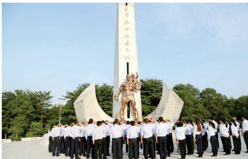
2019年10月25日,广投北海发电公司员工在烈士陵园开展“传承红色基因,牢记初心使命”革命传统教育活动

识”教育,组织员工在烈士陵园开展“传承红色基因,牢记初心使命”革命传统教育活动,开展“安全生产5000天·为奋进的北部湾点赞”“不忘初心做贡献,服务现场我为先”“党建融合生产—促降机组厂用电率”“防风险保平安迎大庆消防比武”等党建项目。