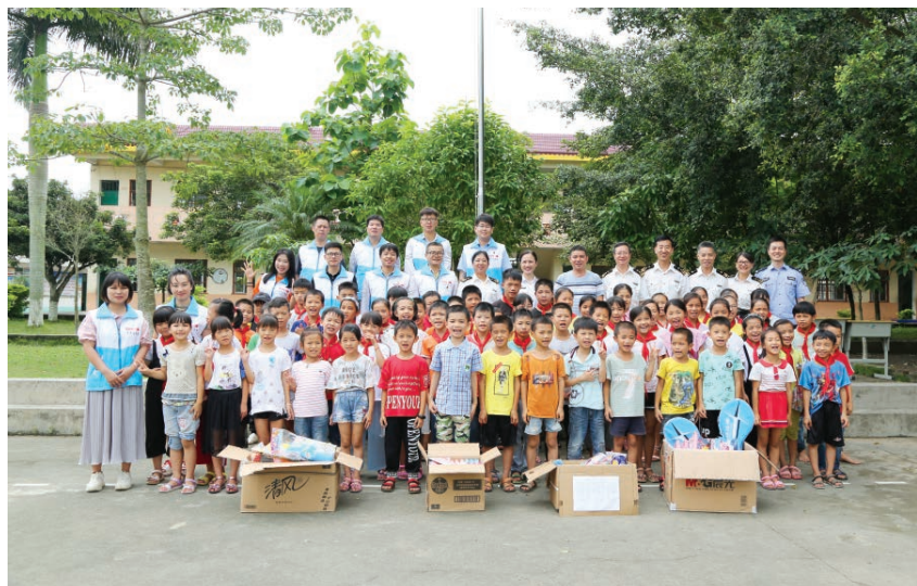
2019年5月31日,广投北海发电公司开展“童心·童梦,助力成长——瓜山小学欢庆‘六一’儿童节”暨志愿者团建活动

【燃煤掺烧】 2019年,广投北海发电公司进一步完善印尼煤掺烧措施,制订年度掺烧计划和每月召开掺烧总结会议。在2018年掺烧试验的基础上,公司重点推进了“热值跟着负荷走”“精准控制仓位”“掺烧经济测算”等措施,有效保障印尼煤掺烧量,在保障锅炉连续安全运行的前提下,实现当日最大掺烧比例突破70%。全年掺烧印尼煤58.3万吨,掺烧比例达31.5%,创历史新高,全年降低燃煤成本3153万元。