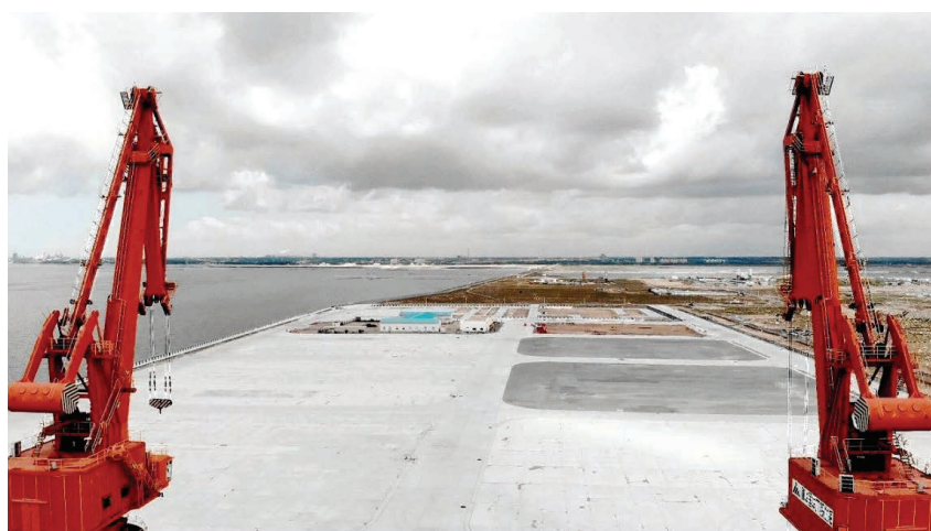
2019 年,国华北海电厂现场航拍图

【安全生产】 2019 年,国华北海电厂落实基础建设和生产建设安全管理措施,通过常抓不懈,做到生产、安全两不误。时刻紧绷安全生产这根弦,全厂干部职工同心协力,安全管理人员、安全措施落实到位,通过加强排查,及时发现和消除安全隐患,确保全厂安全生产持续稳定。年内,全厂安全生产实现人员“零伤亡”、设备“零事故”、消防“零火险”、环保“零污染”的安全目标;应急管理经受住了台风、暴雨等极端天气的实战考验;实现安全生产