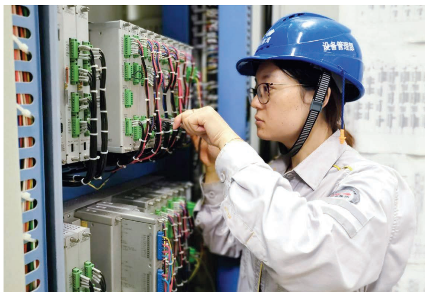
2019年8月26日,广投北海发电公司检修人员正在检修2号机组

【质量控制管理】 2019年,广投北海发电公司坚持质量为本,以全面质量管理为抓手,积极开展技术攻关和QC(质量控制)活动,完成2019年广西工业企业质量管理标杆认定。积极参加广西优秀质量管理成果评审,共有10个QC小组获得广西优秀质量管理小组,其中先锋小组获得全区质量管理小组40周年纪念活动QC成果发表比赛铜奖。