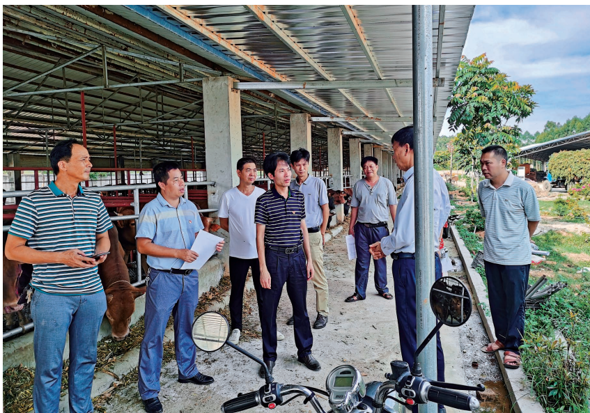
2020年,区财政局组织相关人员到绿牧农民专业合作社肉牛养殖场调研,实地了解财政补助资金使用情况

【财政体制改革】 2020年,区财政局推进国库集中支付电子化改革工作,3月全区所有预算单位全部实行国库集中支付电子化,提升了国库资金管理效益。(宁振辉 李芳宇)