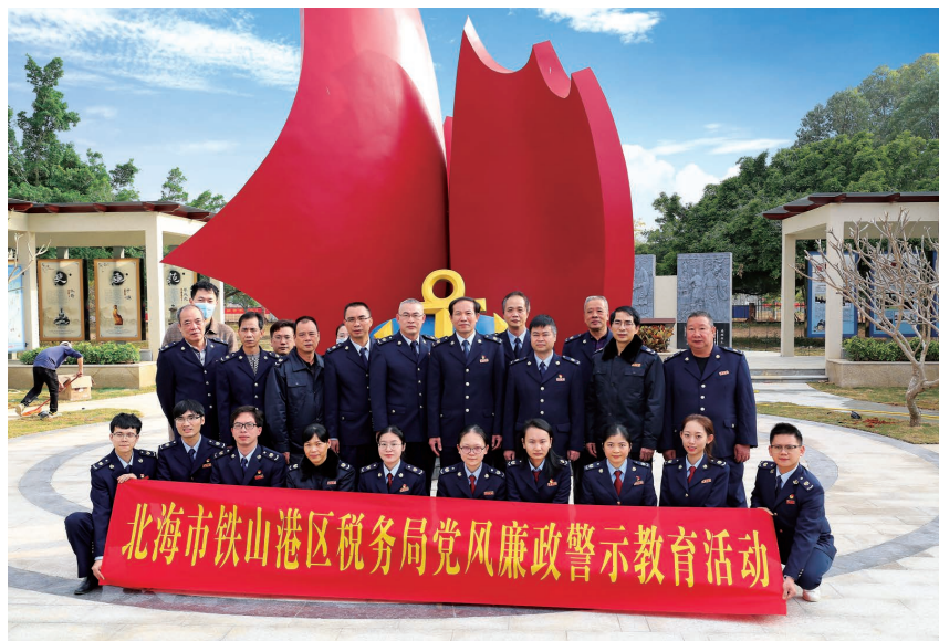
2020年,区税务局组织干部职工到铁山港区清帆廉政文化园开展党风廉政警示教育活动中

【征管质效提升】 年内,区税务局强化征管质量5C监控评价系统的应用,查找薄弱环节,主动提升完善,不断提高税收征管质效。优化注销即办服务事项,简化注销办理资料和流程,缩减办理时间,共为区内办理税务注销328户,采用即办注销和容缺承诺注销308户,占93.90%,注销办理时长平均不超过1小时。(任永昶)