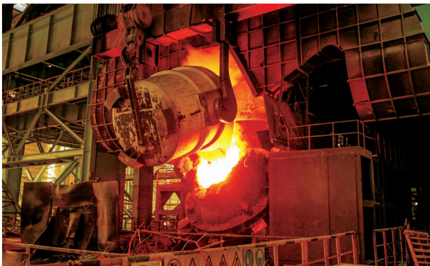
2020 年,北部湾新材料公司精炼 AOD 炉作业现场

【荣誉和专利】 2020 年,北部湾新材料公司已形成流程复合、产品多元、成本集约、高附加值的镍铬合金产业链,生产规模在中国不锈钢企业中排行前三位。年内,北部湾新材料公司被评为广西壮族自治区“高新技术企业”“企业技术中心”“院士专家工作站”“广西博士后创新实践基地”,荣获第二届广西创新争先奖。年内,北部湾新材料公司研发团队和研发人员经过反复试验,成功研发出从不锈钢酸洗废混酸中提取碳酸镍的系统及其方法,并获得专利,全面提升科技创新制造水平和核心竞争力。至