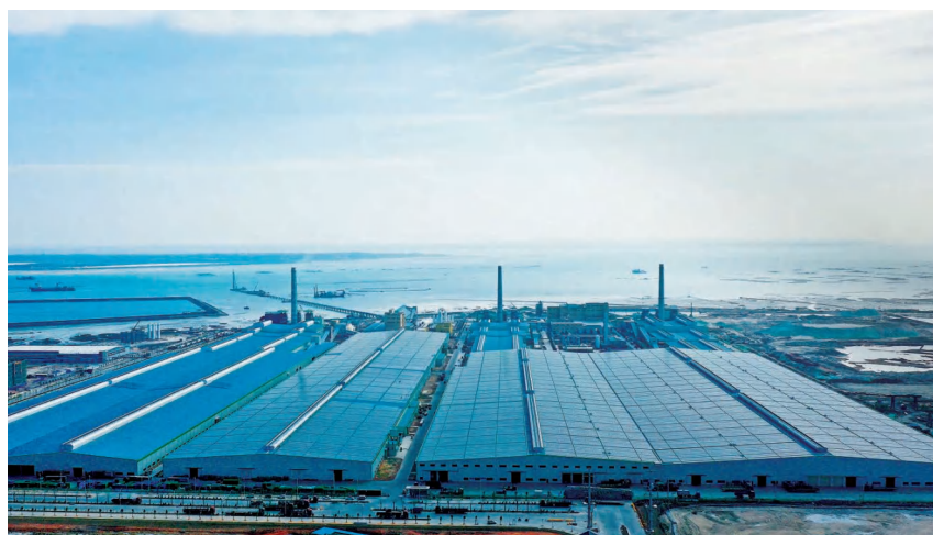
2020年12月31日,信义玻璃(广西)有限公司4条特种超白超厚超薄优质浮法玻璃生产线和2条太阳能光伏玻璃生产线建成 铁山港(临海)工业区管委会 供

【玻璃产业】 年内,铁山港(临海)工业区玻璃产业是铁山港区新增产业,全年实现产值19.10亿元。以信义玻璃(广西)有限公司为龙头,大力开发和生产高端玻璃及制品、玻璃纤维、光伏组件、非通信光纤及制品,努力打造国内一流、国际领先的全产业链玻璃产业园。10月28日,信义玻璃(广