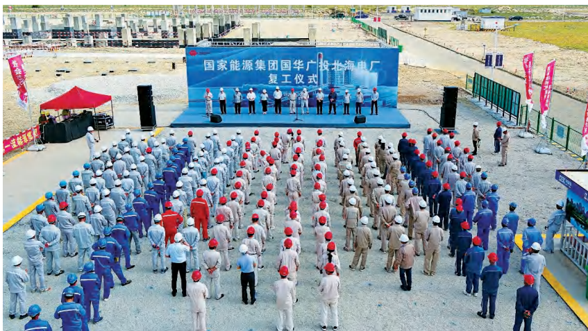
2020年10月1日,国华北海电厂项目复工仪式在神华国华广投北海能源基地现场举行

【铁山港(临海)工业区概况】 北海市铁山港(临海)工业区管理委员会[简称铁山港(临海)工业区管委会]是北海市铁山港(临海)工业区[简称铁山港(临海)工业区]的管理机构。2020年,铁山港(临海)工业区实现规模以上工业总产值954.21亿元,比上年增长7.45%;工业增加值226亿元,增速下降7.60%;固定资产投资97.80亿元,比上年增长126.90%;完成