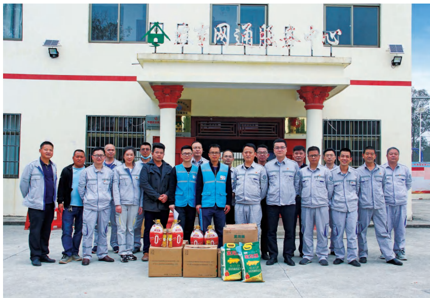
2020年春节期间,广投北海发电公司到扶贫挂点村——合浦县石康镇瓜山村开展慰问贫困户活动

【热电联产】 2020年,广投北海发电公司下属企业——北海市鑫源热电有限公司完成供热蒸汽量34.06万吨,比上年增加14.03万吨,增长70.04%,完成售电7.5亿千瓦时。