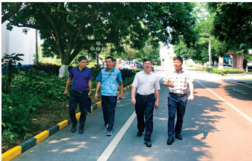
2020年4月,区科商工信局领导到屯河北海糖业有限公司指导糖料蔗购销合同签订工作 屯河北海糖业有限公司 供

【产品质量】 2020年,屯河北海糖业有限公司在产品质量上严格把关,产品质量多次获奖。年内,生产的“中糖”牌白砂糖、“屯河”牌赤砂糖在全国各类质量评比中获全国糖业质量评比产品质量优秀奖,“中糖”牌一级白砂糖获国家食糖及加工食品质量监督检验中心产品质量一等奖等奖项5个。