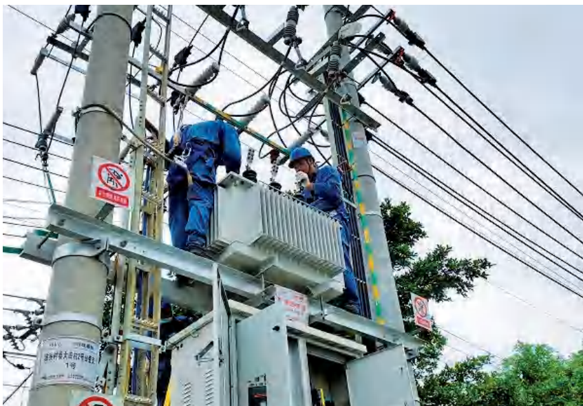
2020年8月,铁山港供电分局在兴港镇陂头村委大田村进行电网改造 铁山港供电分局 供

【优质服务】 2020年,铁山港供电分局加强电力供需形势分析,全力做好电力供应。年内,全区用电需求继续保持较快增长态势,供电量39.85亿千瓦时,比上年增长8.08%。落实企业复工复产电费补贴政策,深入46家企业开展优惠政策宣传,为企业降低电价5%。深入走访港区20多户小微企业客户,主动了解客户的生产经营情况,解决用电难题,进一步“解放客户”;加快客户业扩报装进度,积极与政府部门沟通协调,建立用电需求前期对接机制;一对一服务好辖区内海洋产业园、凤集蛋鸡、太阳纸业、银基等重大项目,新增38户用电容量4.80万千伏安。加大互联网+及费控宣传推广,与38个村委合作共建“电力村委”,推动客户满意度提升。