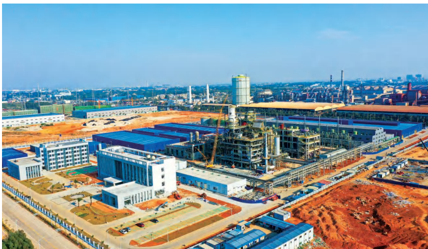
2020年12月31日,广西川化天禾钾肥有限责任公司48万吨优质钾肥项目(一期)全景

税收79.97亿元,比上年下降40.24%;外贸进出口额80亿元,比上年下降10.26%。重点企业有中石化北海炼化有限责任公司、广西北部湾新材料有限公司、斯道拉恩索(广西)浆纸有限公司、信义玻璃(广西)有限公司、广西渤海农业发展有限公司、中石化北海液化天然气有限责任公司、广西北部湾国际港务集团有限公司、广西投资集团北海发电有限公司等。