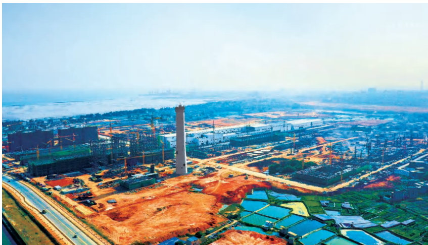
2020 年 12 月 31 日,广西太阳纸业纸板有限公司 350 万吨林浆纸一体化项目施工现场

【港口运行】 2020 年 6 月 10 日,铁山港 1 号—4 号泊位铁路专用线投入使用,打通海铁联运“最后一公里”。年内,北海港铁山港作业区完成货物吞吐量 1948.17 万吨,比上年增长 7.77%。其中:集装箱 32.03 万标箱,增长 31.30%;外贸进口货物吞吐量 780 万吨,比上年增长 5.22%(其中金属矿石和粮食占外贸进口货物总值的 93.6%)。(李承敏)