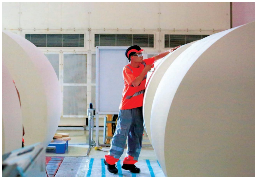
2020年5月,斯道拉恩索北海工厂操作员在纸板车间进行复卷作业

“零事故”为工作目标,明确安全生产。不断健全职业安全管理体系,提高职业安全管理水平,全年共审查更新签发安全管理制度31项。组织开展多种形式安全隐患排查,包括管理层安全巡视、月度安全检查、日常安全检查、员工安全观察等,斯道拉恩索北海工厂各部门积极开展应急演练34次,全年报告安全观察2.27万个,提出安全改进建议2591条,以“零事故”的安全绩效完成8月的年度停机工作。11月16日—22日,斯道拉恩索北海工厂开展主题为“相互关爱”的集团安全周活动。在秋冬季森林火灾防控关键期,斯道拉恩索进一步加大森林火灾防控力度,加强防火知识宣传,大力强化控火救援能力。斯道拉恩索在重点林区共有300多人参与防火宣传和火灾扑救工作,其中80多名林地资产管护部