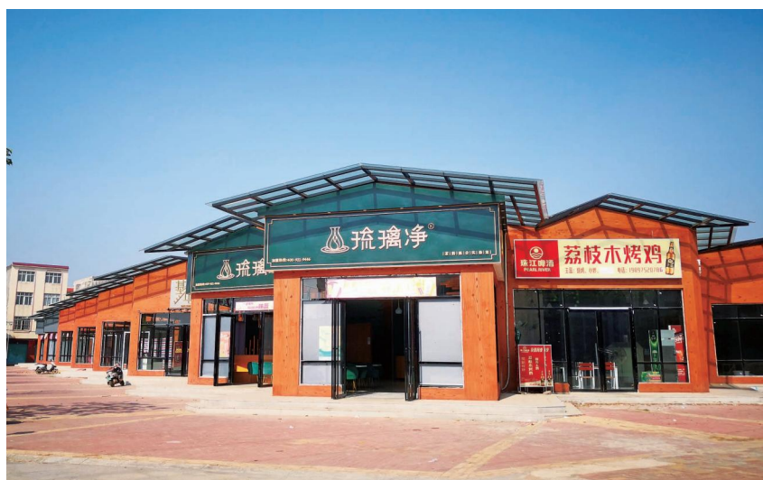
2020 年,南康镇秋风塘村集体经济项目美食街一角

口,从“五个激活”入手,大力推进质量变革、效率变革和动力变革,实现村级集体经济总量增长、质量提高、实力增强。统筹各级资金 1232.5 万元,推动南康镇扫管龙村大棚蔬菜种植、南康社区商铺装修等项目建设,做大做强村级集体经济。年内,全区村级集体经济收入共 524.38 万元,43 个村(社区)全部达到 6 万元及以上,其中 13 个村(社区)收入超过 10 万元,5 个村(社区)超过 20 万元,最高是南康镇黄丽窝村,收入 68.27 万元。积极推进村集体经济组织换证赋码工作,42 个村(涉农社区)全部完成换证赋码,推动集体经济组织实体化。区委组织部印发《关于规范村级集体经济收益分配的指导意见》,联合区财政局等部门印发《关于加强财政扶贫资金支持村级集体经济项目管理和收益分配工作的通知》等文件,规范村级集体经济收益分配。组织力量对村(社区)集体经