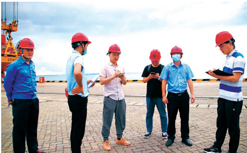
2020年8月4日,人民日报社重庆分社记者到铁山港公用码头采访

服务招商引资 2020年,区委统战部积极通过电话、微信、网络联络与拜访走访相结合等方式主动与广西区内外重要行业商会保持密切沟通联系,一直与上年初考察铁山港区的浙江省政协原副主席、省企业联合会会长张蔚文保持密切联系,为促进几个重大项目在自治区主要领导见证下与北