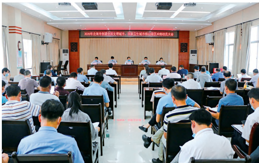
2020年5月6日,2020年北海市创建全国文明城市、国家卫生城市铁山港区冲刺动员会在区政务服务综合楼五楼会议室召开

乡村振兴 2020年,区委大力培育特色农业产业,创建蔬菜产业等8个示范园区,累计创建各级示范园区45个。铁山港区金鲳鱼养殖示范区获广西特色农产品优势区认定;北海市乃志海洋科技有限公司所属养殖场获国家级水产健康养殖示范场称号;“万亩深海养殖基地”和营盘对虾产业核心示范区建设扎实推进。完成南珠珍珠贝插核1257万贝。实施农村“三改”(改厕改厨改圈)和“三清三拆”(清理村庄垃圾、清理乱堆乱放、清理池塘沟渠、拆除乱搭乱盖、拆除广告招牌、拆除废弃建筑),乡村风貌和人居环境持续改善,南康镇秋风塘村荣获全国文明村称号。全区村级集体经济收入突破500万元。乡村旅游发展提速,完成3个乡土特色示范村建设。珠乡旅游休闲山庄被评定为二星级农家乐,大王岭、九曲、周龙3个设施完善型村庄建设基本完成。