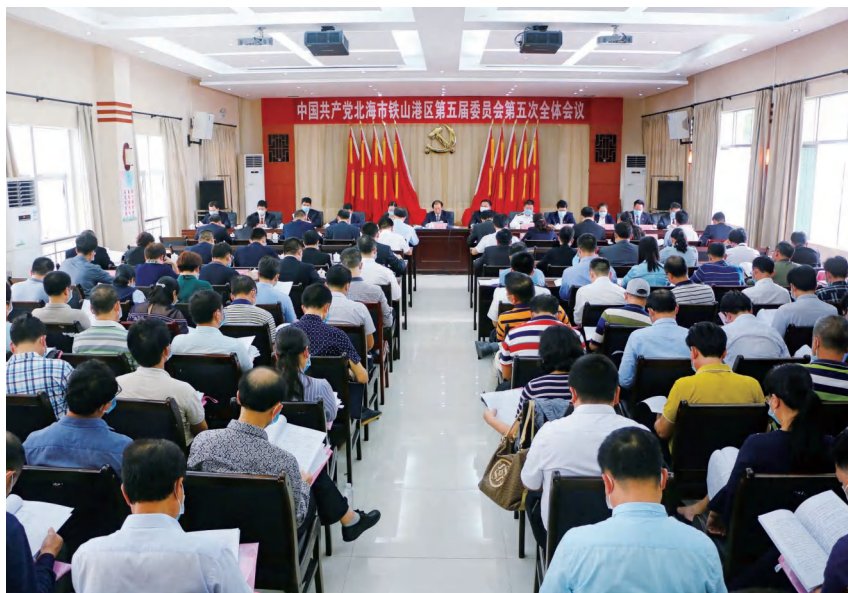
2020年3月25日,中国共产党北海市铁山港区第五届委员会第五次全体会议在区政务服务综合楼五楼会议室召开