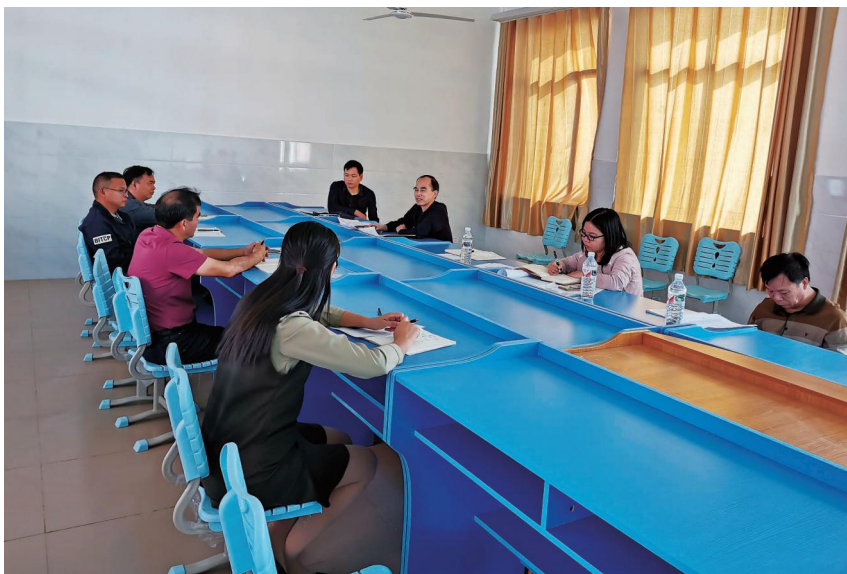
2020 年 11 月 24 日,区委编办领导到铁山港区实验学校调研学校教师编制情况

乡镇行政体制改革 年内,区委编办对区辖各镇开展“一部五室执法队”改革运行情况调研,将各镇事业编制人员划转到各镇人事服务中心,完成乡镇“两个本子”(行政编制本、事业单位编制本)人员编制