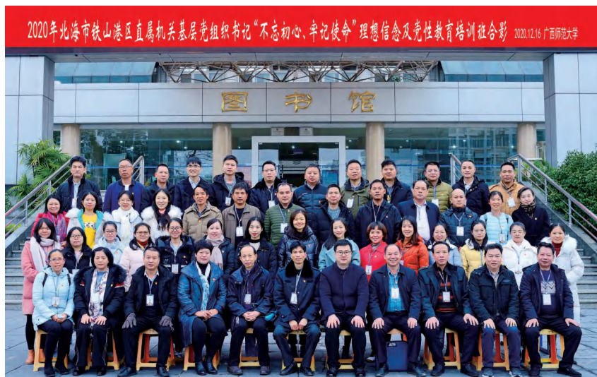
2020 年 12 月 15 日—21 日,2020 年北海市铁山港区直属机关基层党组织书记“不忘初心、牢记使命”理想信念及党性教育培训班在广西师范大学干部教育培训学院举办 区直属机关工委 供