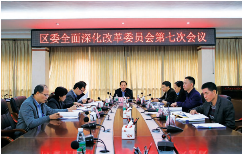
2020年12月24日,区委全面深化改革委员会第七次会议在区政务服务综合楼二楼会议室召开

好下一步全面深化改革工作,提出三方面要求:要深刻认识“十四五”面临的新形势,切实增强改革创新的自觉性、主动性;要落实好主体责任,高质量完成全年各项改革任务;要对标对表中央、自治区党委和北海市委有关改革的部署,科学谋划好2021年及“十四五”时期的改革工作。区委深改委全体成员出席会议,九个专项小组牵头单位负责人、区委深改办有关人员列席会议。