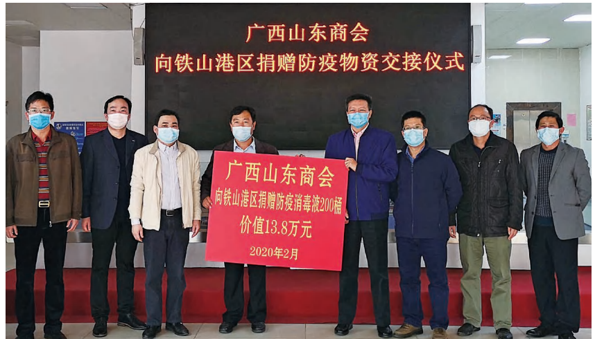
2020年2月17日,区委统战部动员广西山东商会向铁山港区捐赠价值13.8万元的防疫物资。图为捐赠仪式现场

公经济人士和各商会会员、党外人士、在外经商企业家积极参与或从外围助力政府做好征地搬迁工作。推动信义片区D区23.13公顷土地仅用3周时间基本完成项目征地清场协议签订,为自治区重点项目推进保障用地需求。