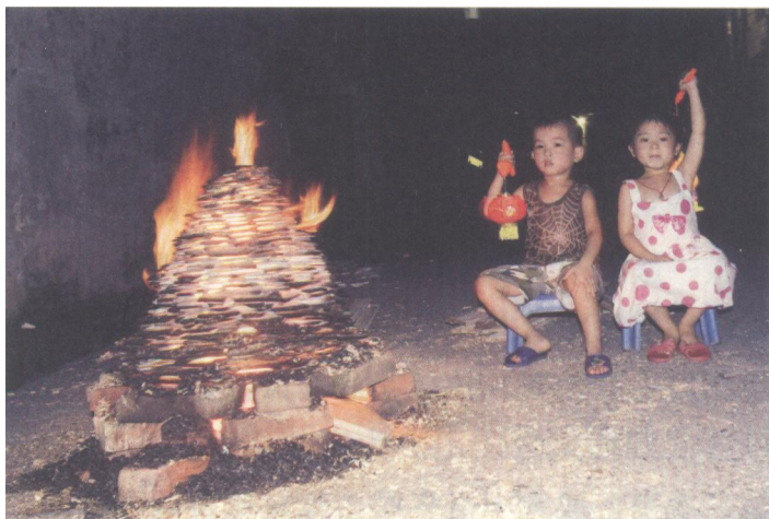
中秋节烧番塔

许瑞棠在《珠官脞录》里说：“烧番塔：是夕，吾邑旧有‘烧番塔’之俗。是日，各地儿童自为结合，十数人分任搜集烧番塔之资料。所谓番塔云者，即佛氏之浮屠，因其始自西域，故有是称烧番塔之事。先由儿童一面搜寻断砖残瓦以为结构番塔之用，一面四出采集柴薪以供焚烧，凡有竹头、木屑之属皆捡拾之。然后择定地点将砖瓦堆砌成直径