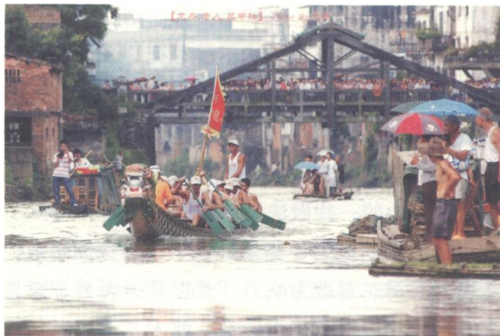
五月初五赛龙舟

包粽子，是为了纪念屈原。屈原于五月五日沉于汨罗江，人们作角黍以祀之，“邑中制粽即其遗意。”合浦城乡，到了端午节前夕，即大张旗鼓包粽子。以糯米为主要原料，裹以腌好的猪肉。合浦人群不一，制粽的方法有异，讲廉州话的地区以冬叶包裹，讲客家话的地区则以萝古叶包裹。清人吴曼云作诗云：“裹就连筒米宿舂，周遭彩缕系重重。青菰褪尽云肤白，笑说厨娘藕覆松。”一些精明的商家，还会多包一些粽子，上街摆卖，有贪图方便之街坊，买来相互馈赠，并用来祭祀祖先。