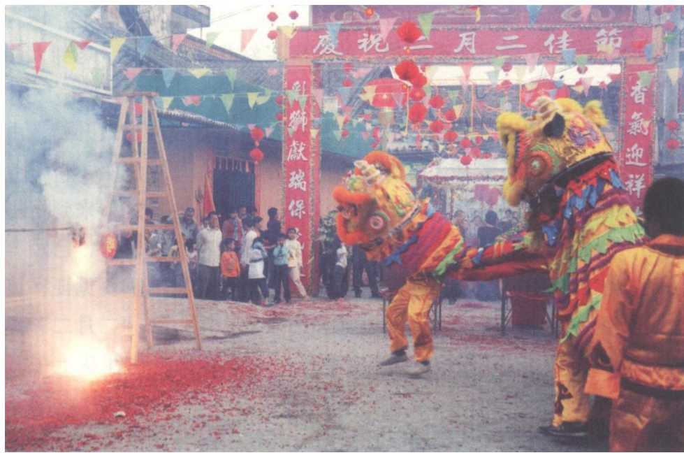
闸口民间节日二月二

除了传统的祭社，社日第二天，还将举行龙舟赛。廉州社公节，以春祈秋报的方式，表达了对土地、山川、树木和庄稼的感恩与崇拜。