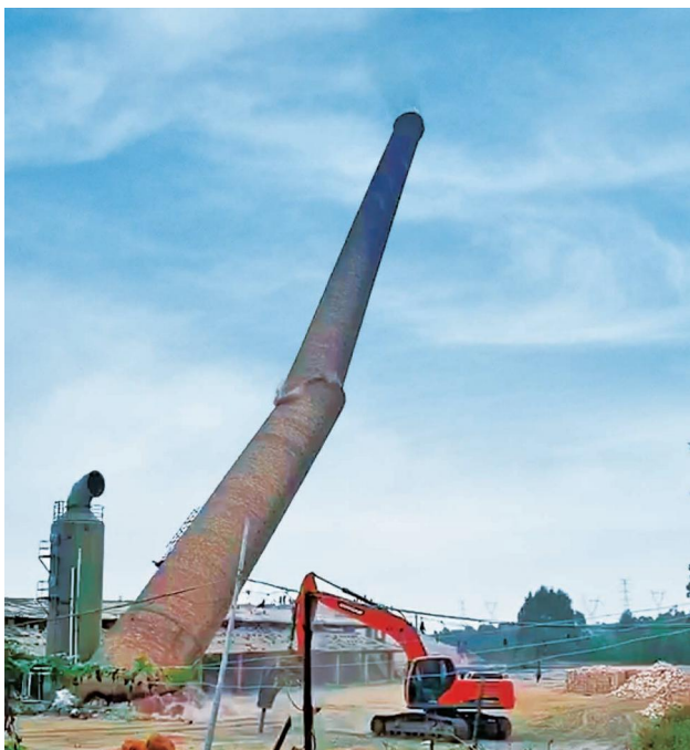
2020年12月22日,铁山港区组织拆除北海市国营营盘林场林兴砖厂落后的烟囱

区在建项目工地安全生产检查,督促建筑企业整改安全生产隐患488处。结合“创城”攻坚行动,开展建筑工地围挡公益广告整治行动。加大农民工工资保障宣传及检查力度,确保农民工工资及时支付,维护社会和谐稳定。