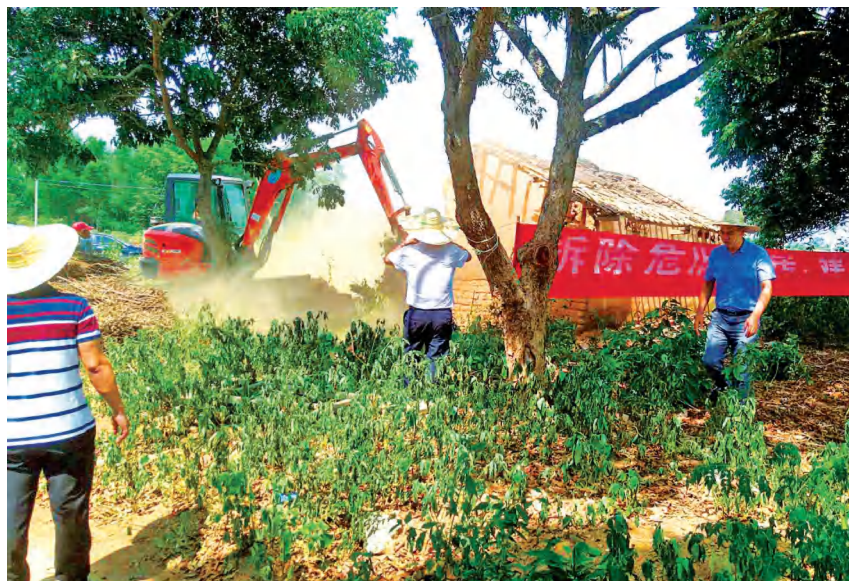
2020年8月,南康镇在社内村开展“三清三拆”行动。图为组织拆除残破构筑物