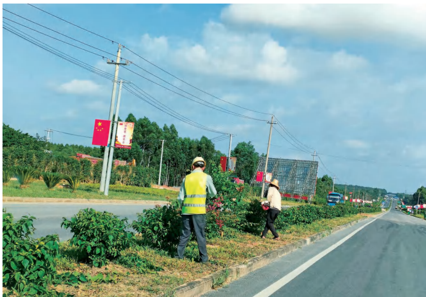
2020年3月17日,铁山港(临海)工业园绿化队队员在铁山港四号路绿化带开展道路绿化修剪工作

城乡环境卫生综合管理,开展城乡卫生整治工作。全年投入330万元用于城乡环境杂草清除、绿化种植(移植、补植)、建筑垃圾清运和围栏建设等项目,共清理杂草25万平方米,清洗道路15万平方米,清运建筑垃圾20万立方米,建设围栏1200米。进一步加强保洁员队伍建设和环卫硬件设施建设,配备环卫保洁员170名,负责铁山港(临海)工业区四号路、七号路、八号路、兴港路等主次干道的清洁卫生工作;配备洗扫车3辆、洒水车2辆,每天出动清洁作业车8辆次,清运各类垃圾100余吨。