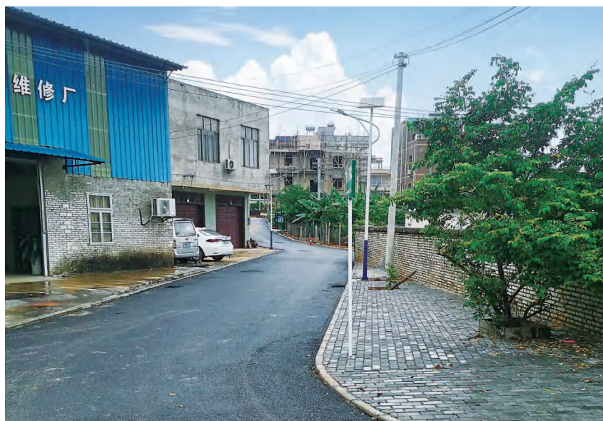
2020 年 8 月 25 日,南康镇车站西里背街小巷改造后现场

【人居环境改善】 2020 年,铁山港区持续推进乡村人居环境改善行动。投资 3100 多万元完成 13 条背街小巷改造建设;投资 400 万元打造营盘镇白龙社区螃蟹塘村精品示范型村庄;投资 500 多万元建设南康镇秋风塘村委糖水铺村、社内村委江仄村和兴港镇小马头村委木头田村 3 个自治区设施完善型村庄及 20 个市级设施完善型村庄;投资 30 万元实施南康镇莲塘村委案塘村、陂塘村委民主塘村、龙门村委龙门村,营盘镇火禄村委符屋村、白龙螃蟹塘村,兴