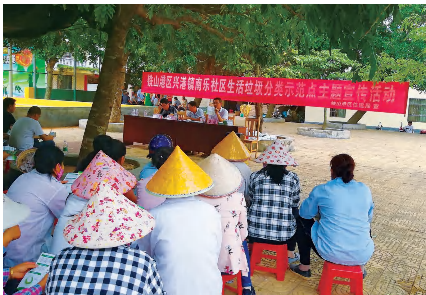
2020年6月11日,区住建局在兴港镇南乐社区开展生活垃圾分类示范宣传活动

环铁山港分公司签订垃圾分类收集合同。年内,全区生活垃圾分类示范点范围内共有楼房2180栋,住户2797户,居民人数1.06万人,示范点居民总户数占全区建成区总户数的21.63%,生活垃圾处理量4.14万吨,无害化处理率100%。