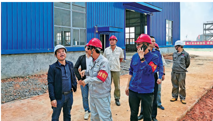
2020年11月5日,区住建局联合区行政综合执法局人员到川化钾肥项目工地进行安全生产检查

【住房保障】 2020年,区住建局牵头开展铁山港区农村危房改造工作,完成农村危房改造90户(其中建档立卡贫困户85户)。年内开工90户,竣工90户,90户危房改造补助资金全部发放,实现开工率、竣工率、任务完成率均达100%,完成脱贫攻坚住房有保障目标。年内,铁山港区农村危房改造工作在自治区绩效考评中被评为优秀。