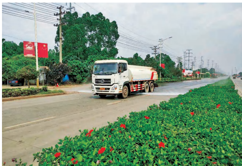
2020年5月20日,大型洒水车在铁山港(临海)工业区四号路进行洒水降尘作业

【污水处理厂监管】 2020年,区住建局强化污水处理厂动态管理,建立专门档案,采取定时检查与抽查相结合,并利用自动监测和人工监测的方式,加大监测频次,确保污水处理厂设施正常运行。(符元菊)