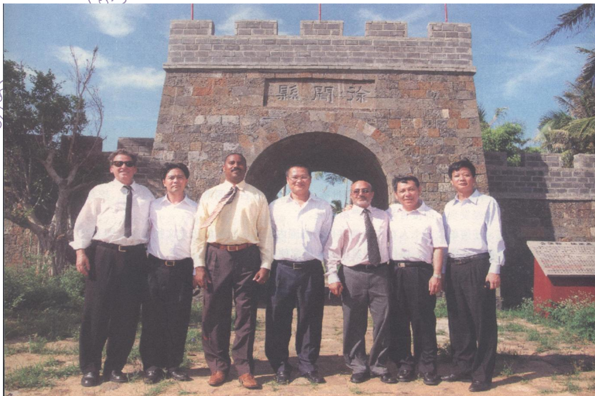
2010年9月26日中共徐闻县委书记、人大常委会主任鍾力，县长林海武偕美国新泽西州大西洋城市长洛伦佐·兰富德一行考察大汉三墩的保护与开发。