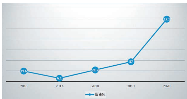
2020年铁山港区固定资产投资增长速度

2020年,铁山港区完成固定资产投资(不含农户)同比增长117.17%,其中民间投资同比增长667.87%,非公投资同比增长178.09%。按行业看,工业投资同比增长198.45%,服务业投资同比增长12.87%,基础设施投资同比增长13.16%,建安投资同比增长40.23%。按登记注册类型看,内资企业完成投资同比增长177.79%,港、澳、台商投资企业完成投资同比增长19.39%,外商投资企业完成投资同比下降98.34%。