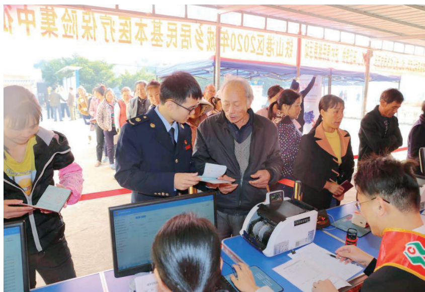
2019年11月,区税务局推行“社保移动缴费服务厅”驻村集中征缴2020年城乡居民基本医疗保险费 区税务局 供

依法行政 年内,区税务局健全税务人员法律知识学习培训长效机制,建立健全全员讲法、学法制度,组织开展相关知识培训5次。通过开展法制宣传教育以及全员警示教育等活动,不断增强税务人员的法治意