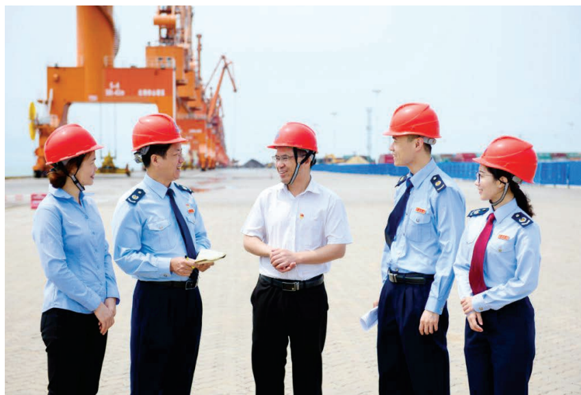
2019年4月17日,区税务局工作人员上门向纳税人开展一对一税法辅导

【党建工作】 2019年,区税务局把党建工作融入征管体制改革和各项工作当中。全年共举办党课教育活动13场,其中党委书记讲党课5场,优秀共产党员宣讲会1场;党支部组织开展作风大整顿、纪律大检查专题民主生活会1场,举行“解放思想、改革创新、扩大开放、担当实干,推进经济社会高质量发展”专题学习研讨会2场;开展学雷锋志愿服务活动、“缅怀先烈、牢记使命”主题党日等活动共23次。在北