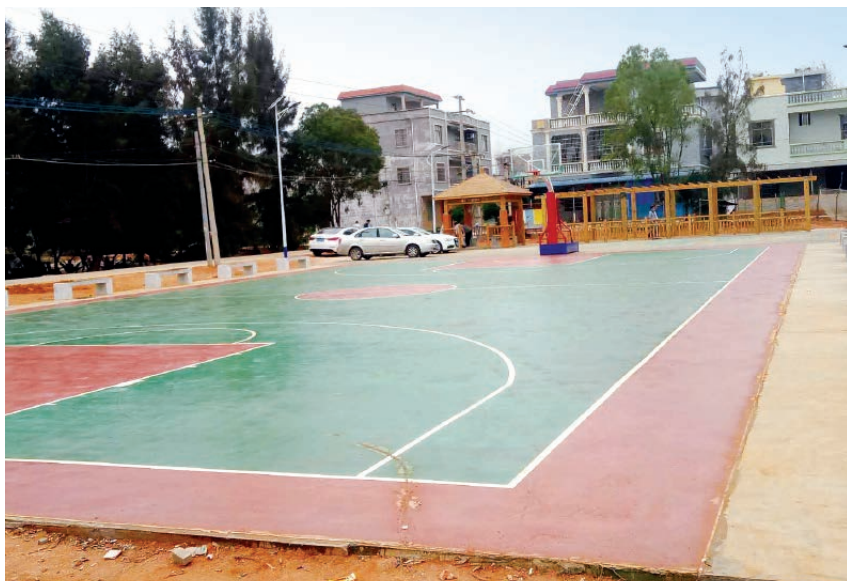
2019 年,铁山港区美丽乡村建设项目营盘镇彬塘村委青山头新村篮球场建成 区财政局 供

政府隐性债务增量。进一步规范财政资金管理,促使资金安全高效运行。区财政局联合审计等部门对扶贫资金进行不定期检查,强化对财政扶贫资金的日常监督,督促扶贫资金使用单位严格执行公示、公告制度,公开扶贫项目资金管理使用情况,强化资金使用的全程监控,提高资金使用效益。区财政局与北海市财政局组成联合检查组,对全区涉及惠农财政补贴资金“一卡通”发放的部门进行重点检查,发现问题及时向各部门反馈,要求立即整改,确保惠农惠民财政补贴资金按政策落实到位。加大区本级预算单位账户管理力度,开展全区财政资金存放管理监督检查工作的自查,从严规范资金存放管理,有效防范资金存放安全风险和廉政风险,提高资金存放综合效益。监督指导各采购单位在“政采云”平台上开展项目采购活动,积极