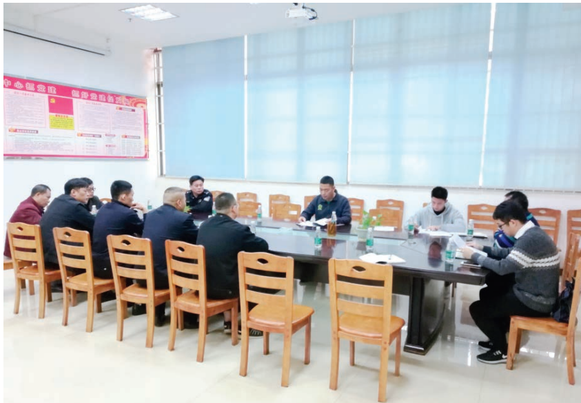
2019年12月13日,铁山港区在铁山港港务集团一楼会议室召开铁山港公用码头堆场专项整治工作推进会议 区自然资源局 供

【土地矿产卫片监督检查】 2019年,区自然资源局按时完成2018年度土地矿产卫片监督检查工作,2018年度铁山港区违法建设占用耕地面积占新增建设用地占用耕地面积比例为7.24%,通过市级和自治区级检查验收工作。