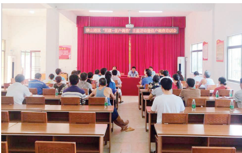
2019年9月27日,区统计局在南康镇南康社区一楼会议室举办铁山港区“党建+住户调查”主题活动暨住户调查培训会

【知识产权保护】 2019年,区市场监管局利用知识产权宣传周、专项整治和日常巡查等活动形式,组织执法人员深入辖区企业、经营户开展商标战