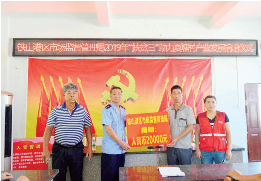
2019年10月17日,铁山港区市场监督管理局2019年“扶贫日”助力夏塘村产业发展捐赠仪式现场