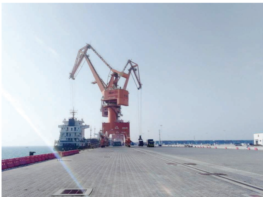
2019年,北部湾港股份有限公司铁山港北暮作业区一角

【县域经济发展】 2019年,区发改局组织制订实施《北海市铁山港区关于进一步促进县域经济加快发展的实施方案》和《北海市铁山港区2019年度县域经济发展工作计划及责任分工表和“补短板”工作计划》,提出全区“十三五”县域经济目标、发展重点及主要任务,明