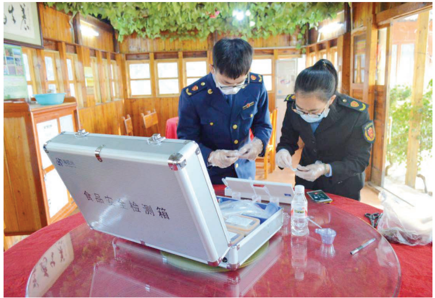
2019年12月4日,区市场监管局执法人员在“南珠节”活动现场开展食品质量安全快速检测 区市场监管局 供

工作:到中粮屯河北海糖业有限公司开展质量提升行动,指导该公司申报并获得2019年度北海市市长质量奖;做好第十六届中国—东盟博览会和商务与投资峰会期间食品相关产品安全保障工作,对辖区6家食品相关产品企业进行检查;在北海市旺海珍珠养殖基地组织开展2019年“质量开放日”活动,传播企业文化,树立质量理念,搭建促进质量管理交流互鉴平台,邀请企事业单位10家,公众48人参与。