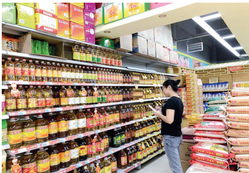
2019年9月4日,区物价部门工作人员在南康家家谊超市开展价格监测检查

的力度,认真做好粮、油、肉、禽、蛋、蔬菜等居民生活必需品和建材、农资等监测分析和信息发布工作。每周到南康旧市场、南康综合市场、建材店、农资店进行实地监测调查。