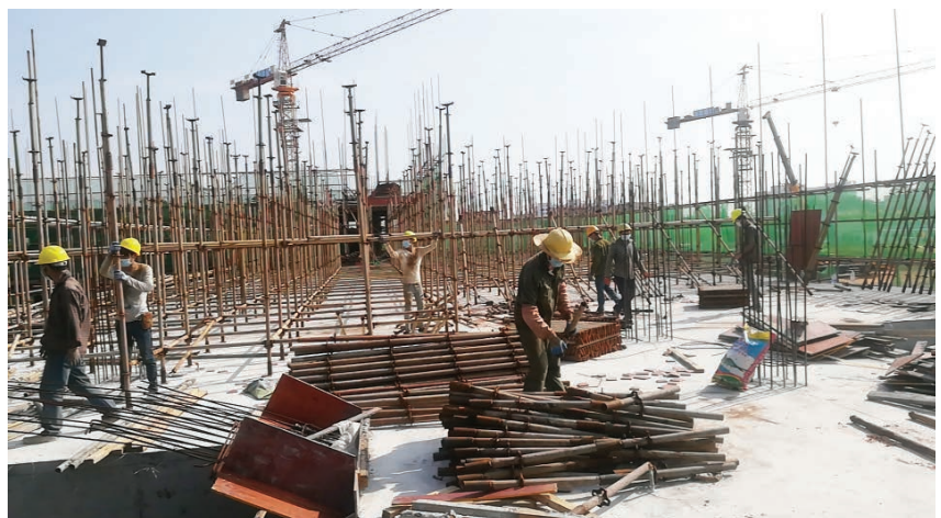
2019年,铁山港区实验学校项目建设现场

2019年,区自然资源局积极配合区政府贯彻落实北海市2019年度地质灾害防治方案。通过汛前制订地质灾害预防应急预案,严格按照要求落实易发地质灾害隐患点排查、隐患信息采集、及时发放避险告知明白卡,编制应急值班表、做好值