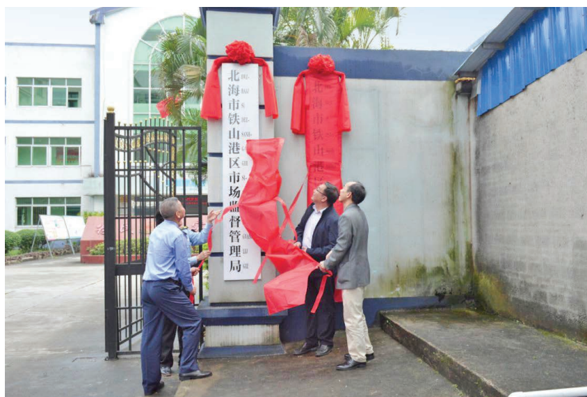
2019年3月19日,区市场监管局揭牌成立

【商事制度改革】 2019年,区市场监管部门围绕“商事制度改革”抓落实,优化营商环境工作力度强。进一步压缩企业登记时间,大力提高行政审批效率,推进市场主体工商登记时效。企业设立登记与印章刻制同步办理,企业开办环节0.5个工作日即可完成。推进企业名称登记制度改革,实行企业名称自主申报,贯彻落实取消企业名称预先核准的规定,在2月28日实现企业名称预先核准与设立登记合并办理的基础上,继续完善有关制度稳步推进申请人自主选择企业名称,提高名称登记效率。推进企业登记身份验证工作,落实企业实名登记制度,能够有效防控冒用身份虚假注册问题,降低制度性交易成本,惠及广大守法、诚信的企业和群众。3月12日起推行企业登记身份