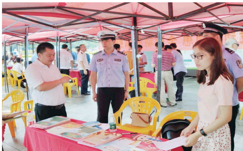
2019年6月14日,铁山港区应急管理局在北海市北部湾广场参加北海市安全生产宣传日活动

【安全生产宣传教育】 2019年,铁山港区积极整合地震、消防、安全生产、防台防汛等方面的科普资源,围绕重大灾害事故及时开展科普和警示教育。认真组织开展“安全生产月”和“安全生产万里行”“119消防安全月”、全民终身学习活动周各项活动。宣传月期间,区安委办共制作发放宣传单1500份、宣传册500份、横幅10多幅及宣传展板3版。通过深入推进“七进”(进企业、进农村、进社区、进校园、进家庭、进机关、进公共场所)宣教活动,让应急管理和安全生产知识不断深入人心,提高居民群众应对突发安全事故的处置技能和自救互救能力。(李祥光)