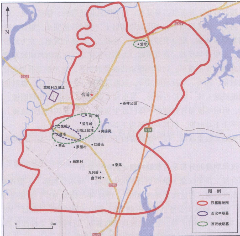
图 4-2 西汉晚期墓与草鞋村汉城址的空间关系

这一阶段墓葬对应草鞋村遗址的第二期文化，第二期分布于A区，开口在⑥层下。遗迹有灰坑、圉泥坑、沟、池、房址和水井等，表明出现了手工制陶作坊，且初具规模。从大量出现的筒、板瓦和瓦当等建筑材料来看，很有可能已经筑城。城址距墓葬区最远的是堂排，直线距离约5千米，表明西汉晚期这一聚落的活动空间已有所扩展。