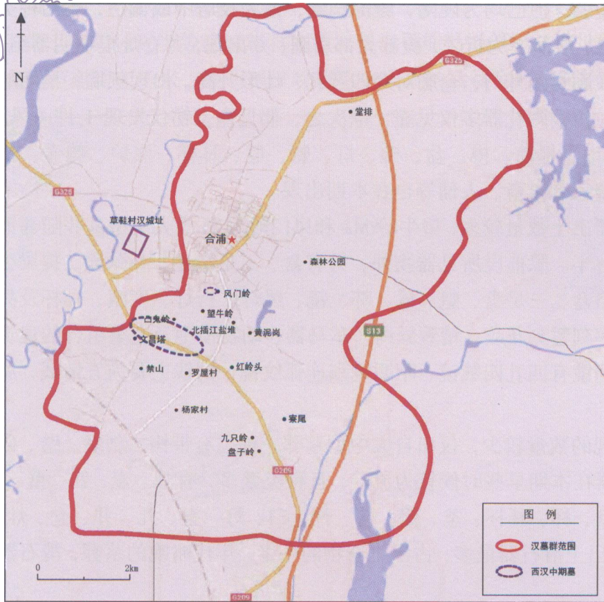
图 4-1 西汉中期墓与草鞋村汉城址的空间关系