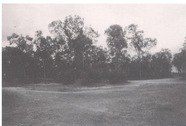
山边与乾体之间的红泥城遗址之二