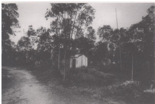
图为山边与乾体之间的红泥城遗址之一

中法战争至今已一个多世纪过去了，昔日的官道已被现代公路所代替，红、白泥城也荡然无存，只有极少数老乾体和老高德，还能找到它们的遗址，以及讲述一点有关的传说。而那些铁炮在 20 世纪 50 年代大炼钢铁的热潮中，被熔进了时代洪流而不复存在。本世纪初的前些日子，笔者到乾体的红泥城遗址采访，这儿与官道遗址近在咫尺，两遗址间茂盛的闲花野草，迎着微风不断地点头，似乎在向笔者诉说着这儿百多年前流传下来的故事。