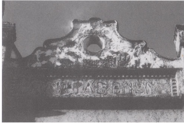
珠海中路 80 号商铺，其临街立面女儿墙有一英文铺号 NAM TAI CHUN（译“南泰昌”）