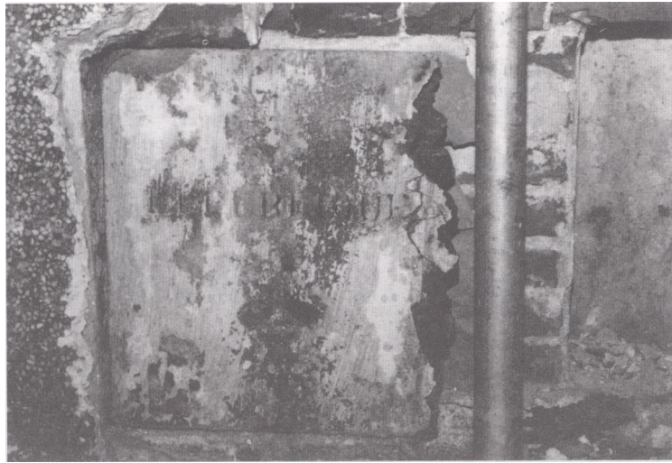
镶嵌在法领馆旧址墙角的法文碑（译：法兰西共和国）