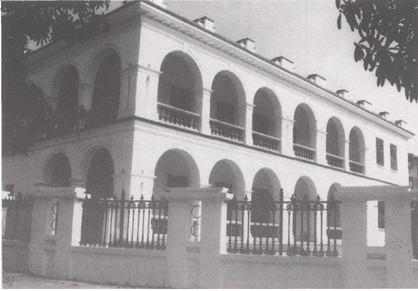
平移后按原貌修复的原英领馆