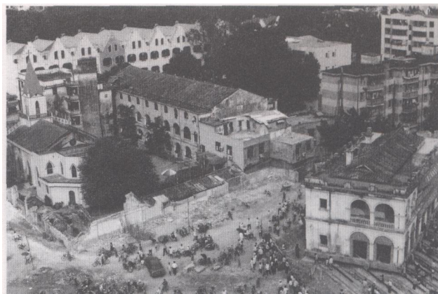
原英领馆已平移到终点（图中右下角建筑）