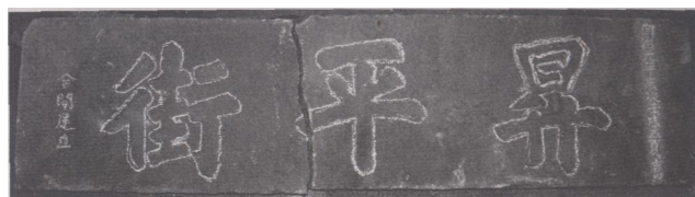
图为立于同治元年(1862)的升平街路碑。此碑于2006年1月7日被发现，碑高43.5厘米，宽170厘米。升平街是昔日大街若干条短街中的一条