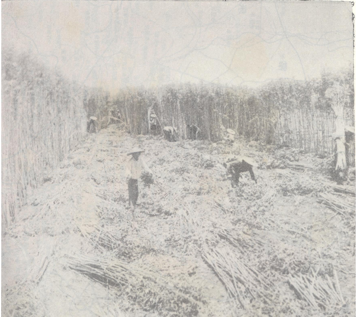
社员们在收获黄红麻