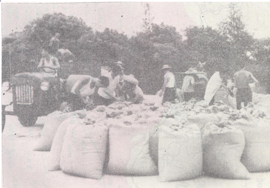
党江公社社员踊跃交爱国粮