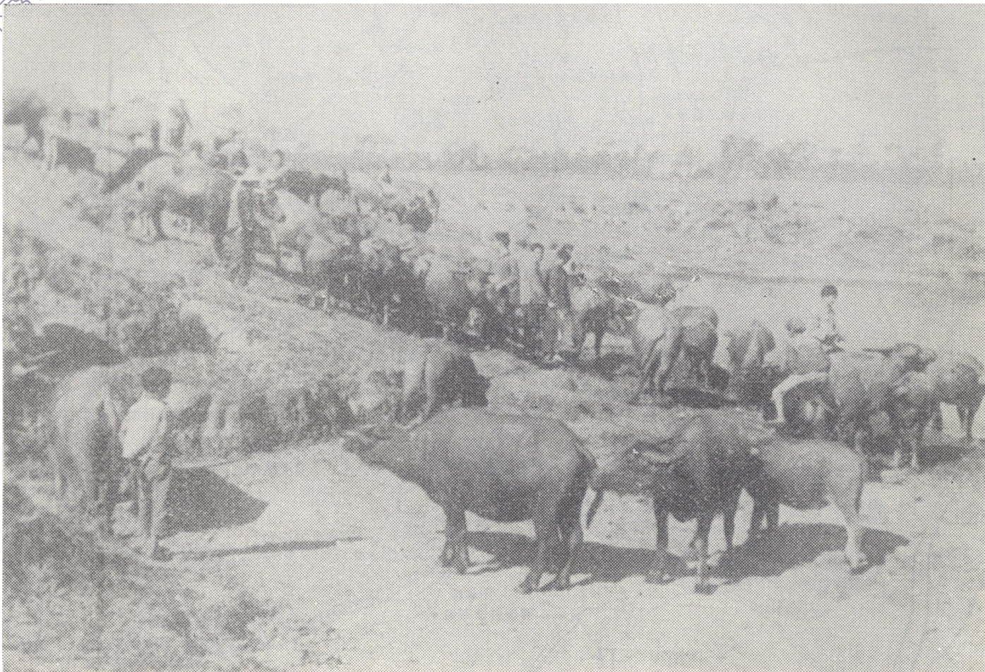
图为龙秋井生产队放养的牛群