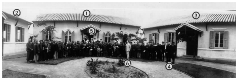
图三：20世纪初，英教会一官员到北海视察普仁麻风院时，受到麻风院全体病人及医生、传教士的热烈欢迎。