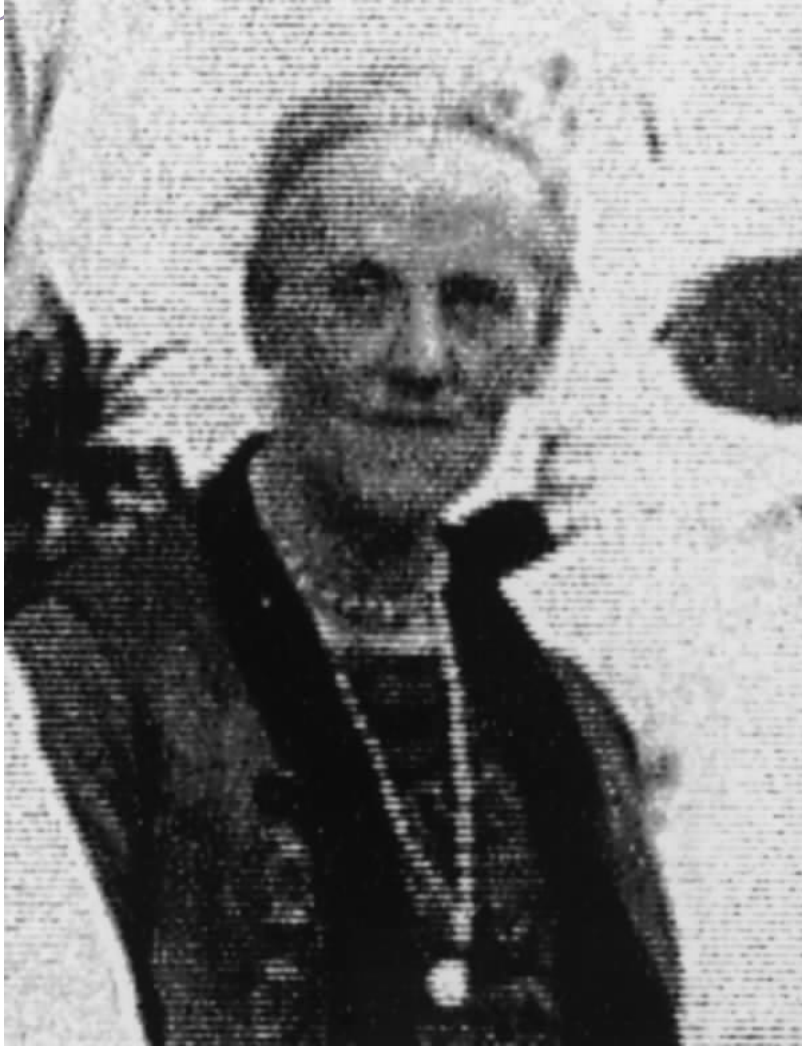
图为原普仁医院创始人之一柯达夫人。1925年摄于北海（集体照截图）。