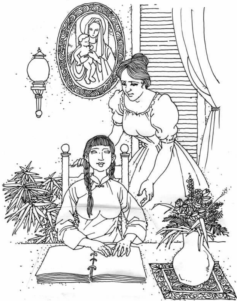
图为陂箴夫人用自制的盲文读物教一位女盲人学习。张国权画

普仁医院于 1886 年在北海市区南面的高地落成后，其大门的方柱上挂着一块黑色的牌匾，上书“安立间教会”五个大字。安立间是英文 Anglican 的音译，起初是指英格兰圣公会，后泛指各国圣公会。这块牌子向人们宣示，基督教新教圣公会就设在普仁医院。由此可见，普仁医院的创建日，也是基督教新教传入北海的日子。两者同一时间传入，在同一地点开展工作，且密不可分，标志着这所医院是教会医院，它除传教以外，还把西方的医疗卫生及文化教育传入北海及其周边地区，在北海近代史上开启了新的一页。本文主要是介绍安立间教会在北海设立后所起的作用。